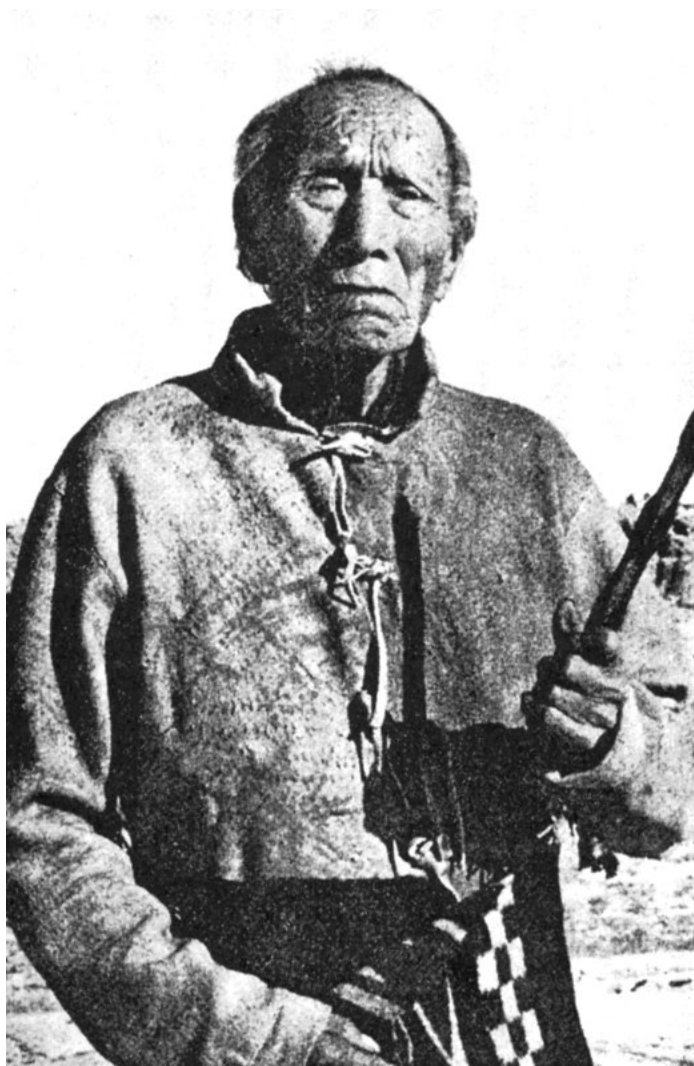
Černý jelen, 1947