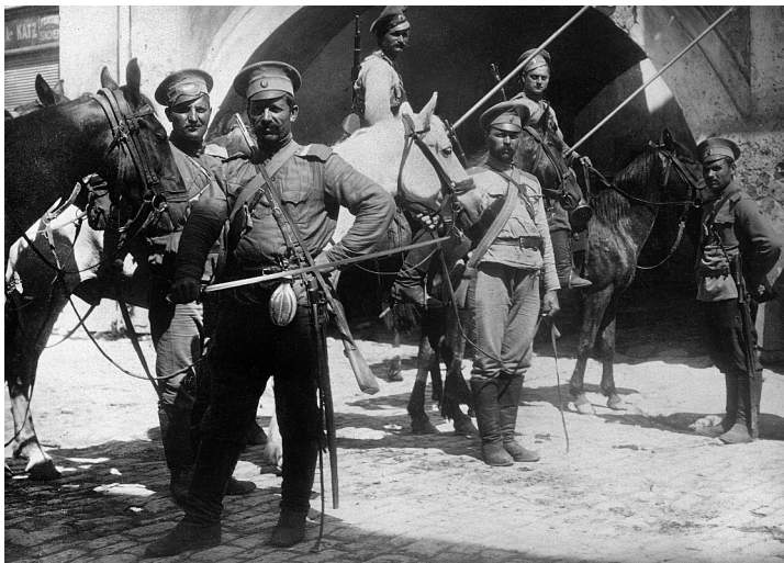
Kozáci ruské carské armády v roce 1915

peni požáry, jež se prozrazovaly sloupy dýmu a v noci zářily rudými záplavami. Všechny domy na Hrebli u Lucka a mosty byly spáleny.“ Ničení a pálení, jak dosvědčuje pamětník, bylo tehdy předčasné, neboť ruská armáda svým vítězným postupem posunovala frontu opět dál na západ a frontová linie se na více než půl roku ustálila.