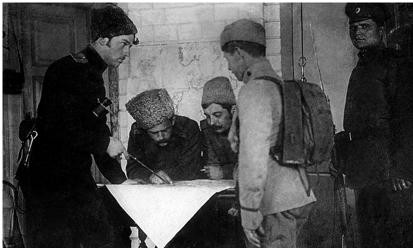
Dobrovolníci České družiny při výslechu zajatce

Zachránil je německý generál Hindenburg, když koncem srpna v urputné třídení bitvě u Tannenbergu uštědřil ruské armádě zdrcující porážku. Přesto události na frontě vyznívaly slibně.