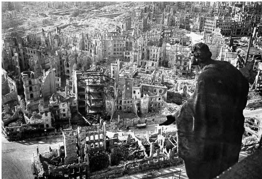
Drážďany po bombardování