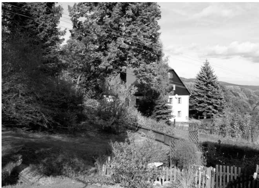
Horská vesnice Boxgrün – Srní dnes