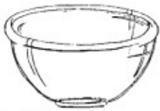
skleněná mísa bez vzoru a nápisů