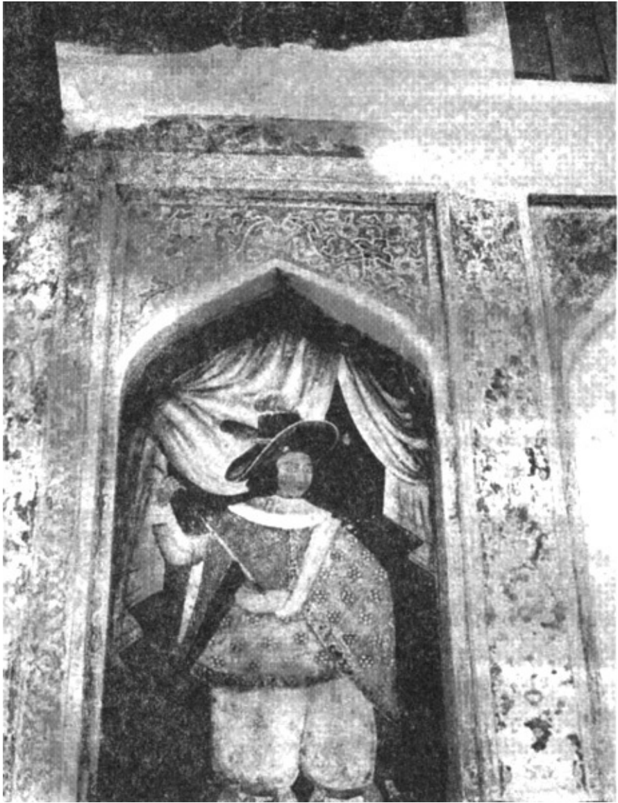
Nástěnná malba v Isfahánu, znázorňující evropského návštěvníka. Isfahánské pavilony Chichil Sutun (Čtyřicet sloupů), pocházejících z konce 16. století a přestavěných v roce 1706.

jejich sunnitských sousedů na obou stranách – na východ od Střední Asie i Indie a na západ od Osmanské říše.