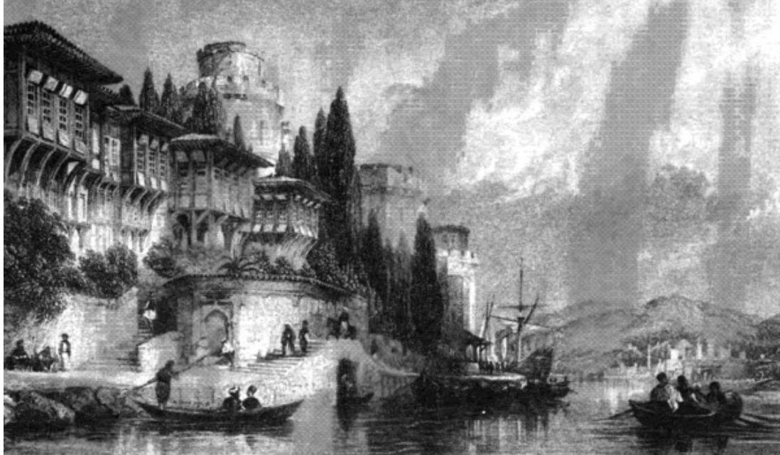
Bospor s hrady Evropa a Asie od Thomase Alloma.

V Evropě však byly křesťanské armády mnohem úspěšnější. Na konci 11. století byli muslimové vypuzeni ze Sicílie a v roce 1492, téměř osm století po muslimském vylodění na území Španělska, skončila vítězně zdlouhavá reconquista (křesťanské znovudobytí Iberského poloostrova), která otevřela cestu k expanzi křesťanů do Afriky a Asie. Evropské křesťanstvo však ohrožovaly i další muslimské útoky. V letech 1237–40 si na východě tatarská Zlatá horda podmanila Rusko a v roce 1252 chán Zlaté hordy spolu se svými poddanými konvertoval k islámu. Rusko bylo spolu se značnou částí východní Evropy podřízeno muslimské vládě a teprve na konci 15. století se Rusům definitivně podařilo vymanit zemi z toho, co nazývali „tatarským jhem“. Mezitím však začala třetí vlna muslimského útoku v podobě náporu osmanských Turků, kteří dobyli Anatolii, zmocnili se starověkého křesťanského města Konstantinopole, vtrhli na Balkánský poloostrov, který kolonizovali, a dokonce ohrožovali samotné srdce Evropy, když