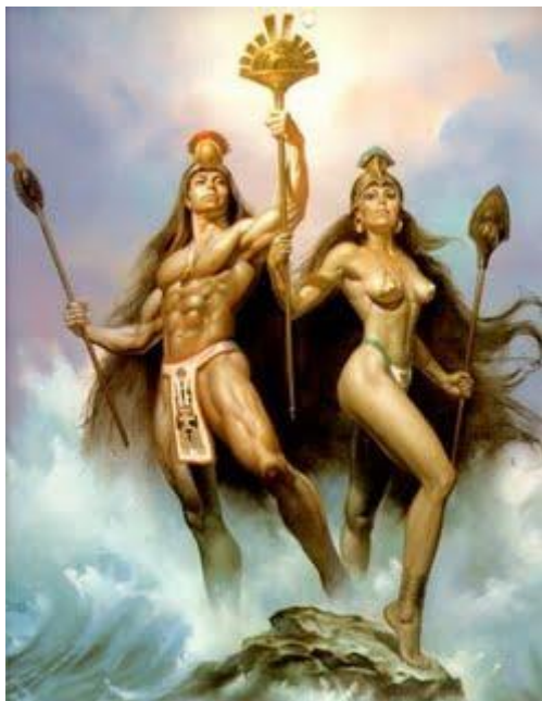
Manco Capac a Mama Ocllo dle současného malíře

Jedna z pověstí o jezeru Titicaca praví, že když se vytvořil vesmír, existovalo zde pouze toto jezero a jeho vody byly svaté. Bůh Stvořitel, Wira-cocha, nařídil Slunci a Měsíci, aby se vynořili z jeho vod a aby dali světu více světla. Když vystupovali z vod, Měsíc prý zářil více než Slunce. Když vesmír viděl tuto nespravedlnost, zesmutněl. Měsíc i Slunce potemněly, nebo ztmavlo a vesmír se rozplakal. Jeho slzy