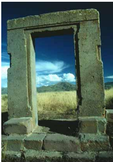
Relikt vstupní brány v Tiawanacu

Historie a prehistorie osídlení okolí jezera Titicaca je velmi složitá a pohnutá. K jejímu objasnění přispívá nejen archeologie, ale i geologie, geofyzika, paleontologie, limnologie a další příbuzné obory. Výsledky dosavadního výzkumu poukazují na skutečnost, že osídlení a pohyby obyvatelstva v různých údobích či epochách zde byly vždy úzce spjaty s probíhajícími klimatickými změnami.