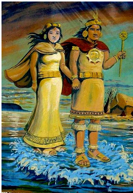
Manco Capac a Mama Ocllo vystupují z vod jezera Titicaca

Podle mytologie, synové Boha Slunce, Manco Capac a Mama Ocllo, se vynořili z hlubokých vod jezera Titicaca, aby založili incké impérium, srovnatelné svou s římským či egyptským. Inkové dokázali postavit na vysokou úroveň zemědělství, vodní hospodářství i stavebnictví a podle vzoru svých dávných předků, naučili se žít v souladu s přírodou v drsném a nehostinném prostředí andského Altiplana. Je proto naší povinností usilovat o zachování biodiverzity přírodního prostředí a původního ekosystému.