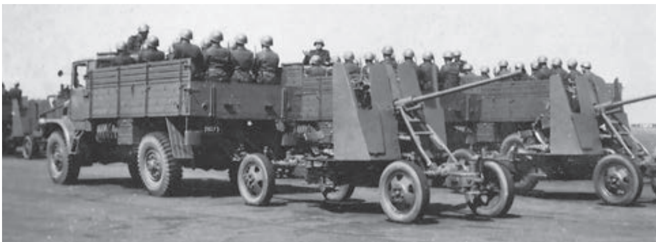
T 128 s 37mm protiletadlovým kanónem vz. 39 nacvičuje na přehlídce (30. dubna 1952)