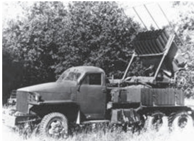
Studebaker se 130mm raketometem vz. 51 (ev. č. 44557)

Převážnou část automobilní techniky používané armá- dou tvořily kořistní typy, které v důsledku špatného tech- nického stavu a nedostatku náhradních dílů způsobovaly při používání značné těžkosti. Pro více než 800 kořistních