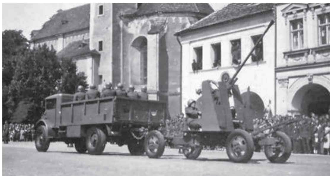
Ford Canada F-60 (ev. č. 141561) s 37mm protiletadlovým kanónem vz. 39 na přehlídce v Domažlicích (1951)

vozidla však nebyla v úplném a dobrém technickém stavu, naproti tomu vojenská správa byla nucena při výměně předávat vozidla pojízdná a s náhradními součástkami. V důsledku těchto kroků se zvýšil k 1. lednu 1952 koeficient technické pohotovosti. V roce 1952 ještě proběhla výměna 150 kusů vozidel, čímž se možnosti doplnění automobilů z civilu vyčerpaly.