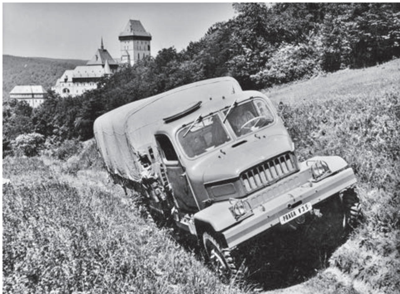
Tovární předváděcí vozidlo V3S při pořizování propagačních fotografií u hradu Karlštejn, léto 1956