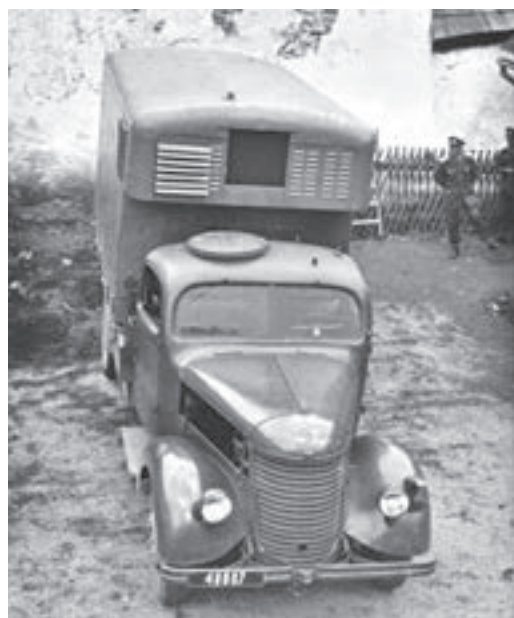
Praga RN: chladič přepravník masa

strukci podvozku s žebřinovým rámem a vzduchem chlazeným vznětovým motorem. Takový automobil však žádný z domácích výrobců ve své nabídce neměl. Vojenská správa až do roku 1950 dostávala z výroby pouze běžná silniční vozidla s nepatrnými úpravami, která nemohla zajistit potřeby vojsk (např. Praga RN, RND, Aero A-150). I přes určitý pokrok v modernizaci našich ozbrojených sil bylo jejich využití především v terénu minimální.