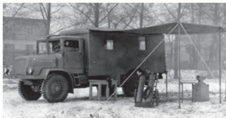
T 128: automobilní pojízdná dílna typ „B“, ev. č. 48512 [1]