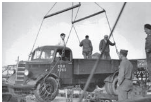
Britský nákladní automobil Bedford M [2]

vozidel). Z tohoto počtu se mnohé automobily nacházely v nepojízdném stavu (stupeň provozuschopnosti se pohyboval mezi 55 až 70 %), hlavně kvůli nedostatku náhradních dílů pro kořistní, ale i válečná vozidla, především však pro automobily vyrobené před 2. světovou válkou. Náhradní díly se vyráběly pro všechny typy tehdy vyráběné domácími výrobci a pro tři typy zahraniční (Ford Canada, GMC a osobní automobil KDF). V tomto roce se také uskutečnil dovoz náhradních dílů za 11 milionů korun pro pět typů terénních vozidel (Ford Canada, Studebaker, GMC, Willys a Dodge).