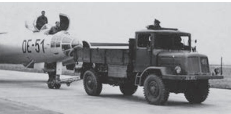
T 128 jako tahač bombardéru Il-28, Přerov (7. listopadu 1955)

použito dvojí oráfování (tovární označení Tatra 131), s cílem ověření možného zlepšení terénních vlastností. VTÚ dostal za úkol vypracovat do července 1951 nové podmínky pro terénní třítunový vůz. Československé závody na výrobu vozidel (ČZVV) měly zabezpečit převedení výroby T 128 na T 111. Ministerstvo zahraničního obchodu (MZO) ve spolupráci s MNO mělo do 20. července 1951 prověřit možnost získání licenční výroby třítunového automobilu nebo možnost výměny T 111 za ZIS 151. Nakonec se ukázala jako nejperspektivnější varianta vývoje a výroby nového tuzemského třítunového terénního vozidla.