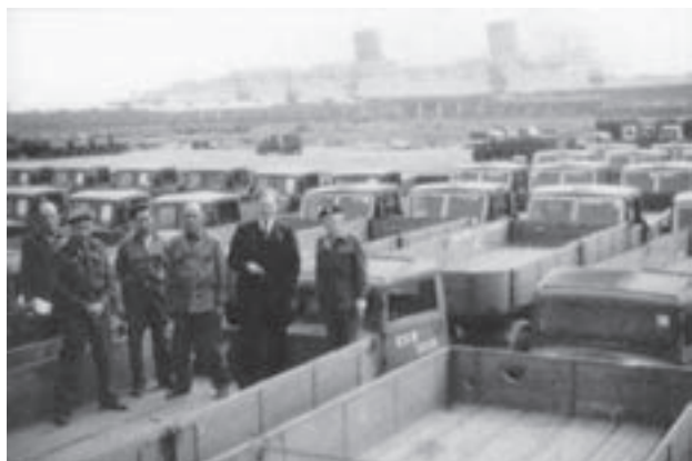
Tahač značky Ford s návěsem (Ford 118T), za nimi pravděpodobně britské šestitunové nákladní automobily Vulcan [2]