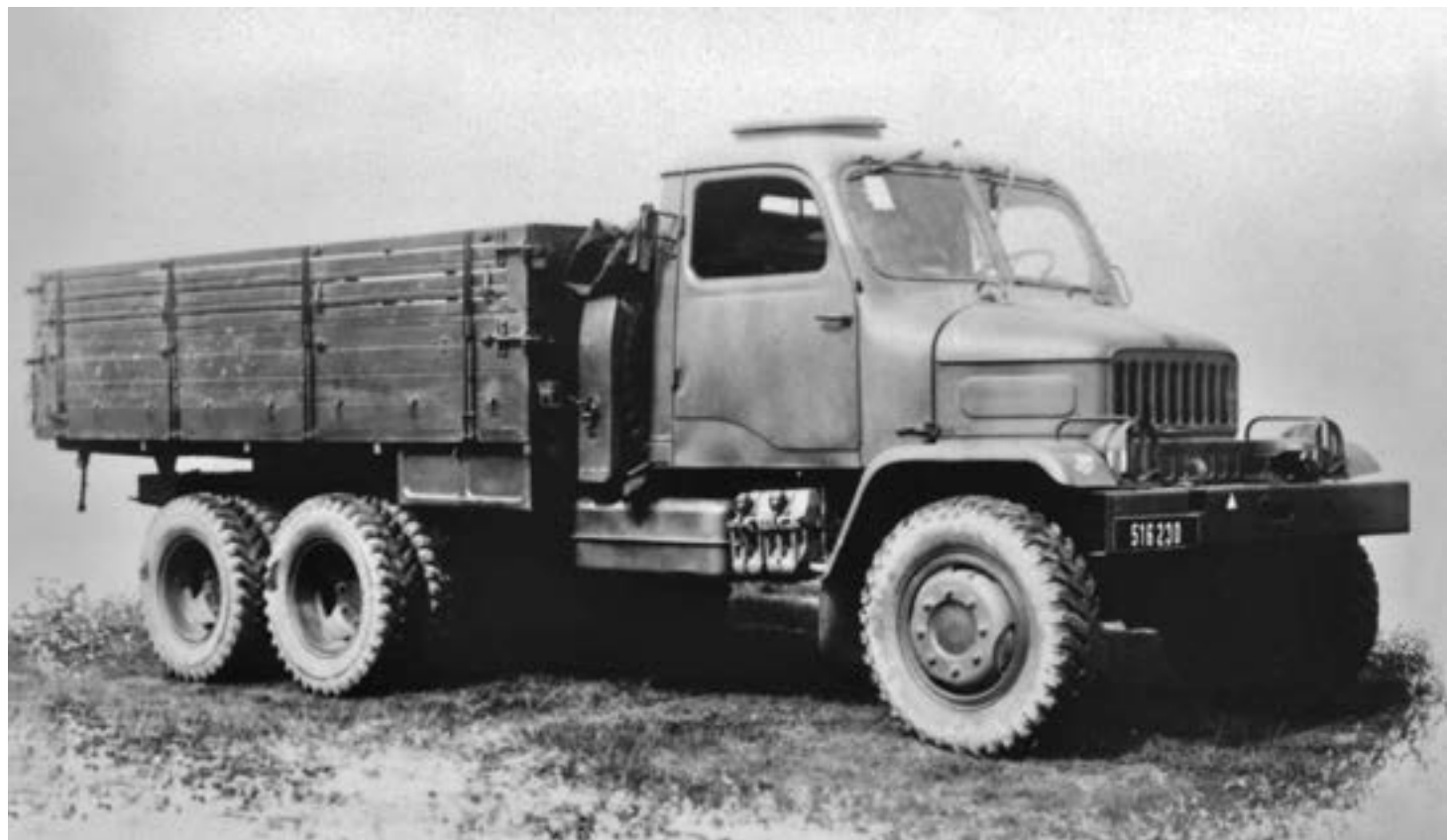
V3S z 1. autopraporu