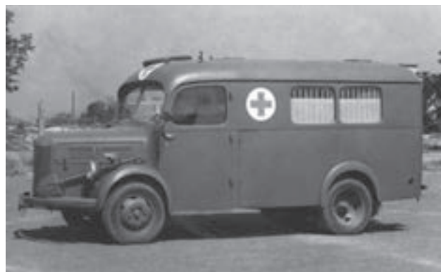
A-150: čtyřlůžkový zdravotnický automobil