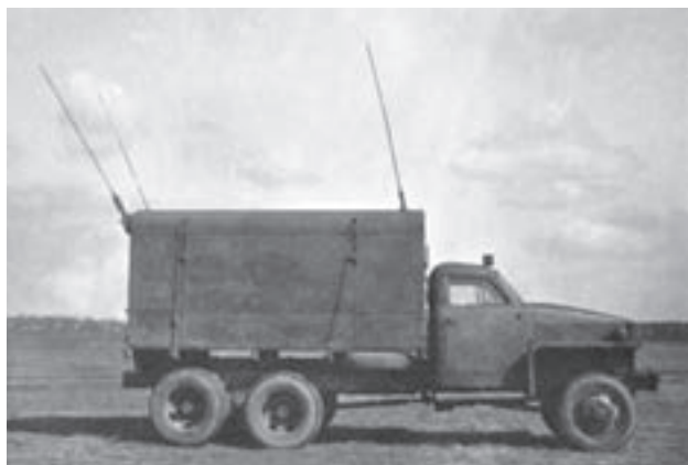
Studebaker SCR 399: radiovůz z výzbroje Českosloven- ského armádního sboru v SSSR

typů vozidel, zařazených v jednotlivých složkách ozbroje- ných sil, bylo pro jejich udržení v provozu zapotřebí více než 300 000 různých náhradních součástí a příslušenství. Po vyčerpání kořistních skladů se tyto automobily staly z velké části nepojízdnými, výroba náhradních dílů v tu- zemsku nemohla být pro nízké počty jednotlivých typů re- alizována. Na základě těchto skutečností se automobilový park stal postupně nespolehlivým.