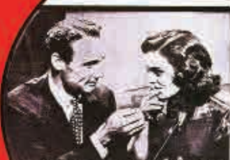
YOUTHFUL MARIHUANA VICTIMS