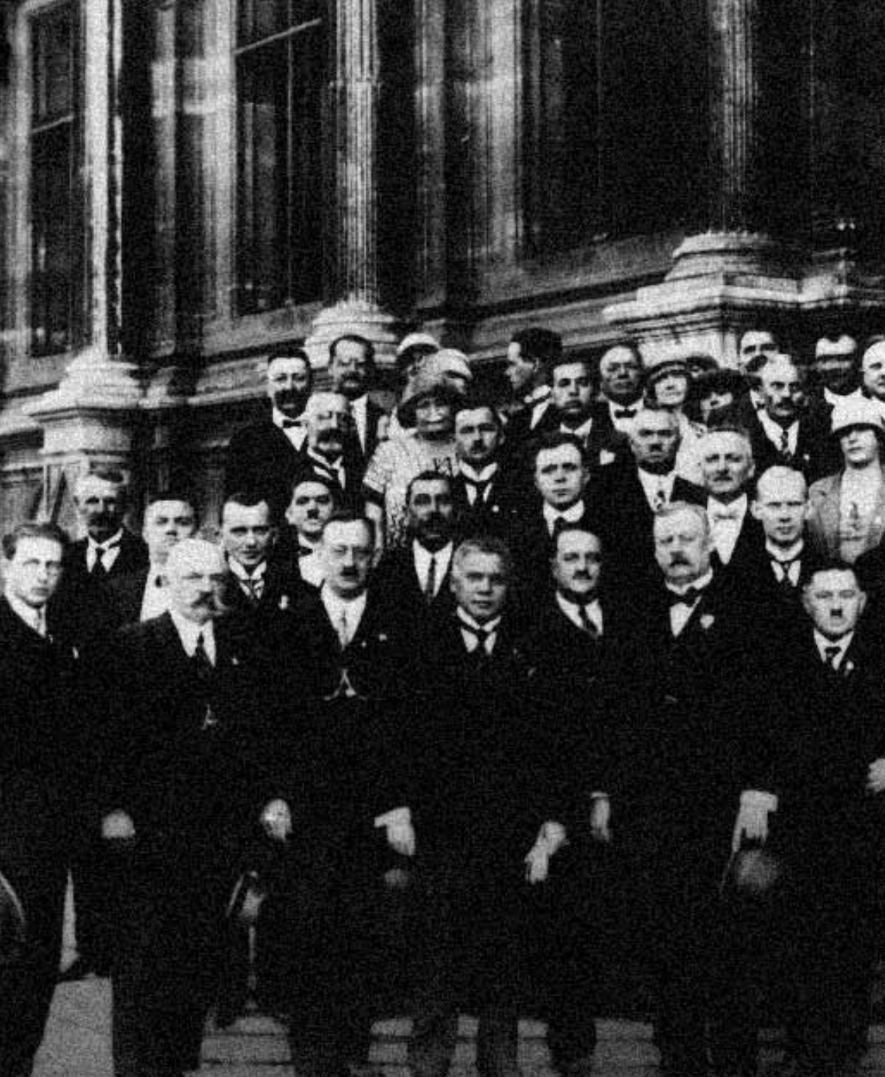
Sjezd pražských kavárníků v Paříži, kolem roku 1928, děda v první řadě druhý zprava, babička vedle něj