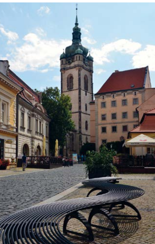
Svatováclavská ulice směrem ke Kostelu sv. Petra a Pavla a k zámku

městem až Karel IV., který sem dal přivést z Burgundska a Champagne vinnou révu a založil zde vinařství. Hospodářsky Mělník prosperoval za vlády Jiřího z Poděbrad, naopak stagnoval a upadal od konce 15. století. Vinařství doznalo největšího rozmachu v období od husitských válek do třicetileté války, kdy byly rozšiřovány vinice a bohatnoucí měšťané investovali do náboženských svatostánků. Dalšího markantního rozvoje se město dočkalo až v době po vzniku první republiky, kdy byly vybudovány přístav, okresní úřad, kulturní dům, pošta, kanalizace a provedena