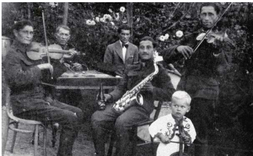
BLONDÁČEK NA ROMSKÉ MUZICE. „Tato fotka budiž důkazem, že mě hudba zajímala už roku 1942.“