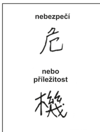
Obr. 1.3 Čínský znak wej-ji pro krizi

Například v čínštině se pro krizi používá znak wej-ji (viz obrázek 1.3), který je složený ze znaku pro nebezpečí a znaku pro dobrou příležitost. Takovéto dichotomické pojetí upozorňuje nejen na možný přínos krize, ale také na potenciálně nebezpečné aspekty krizového stavu.