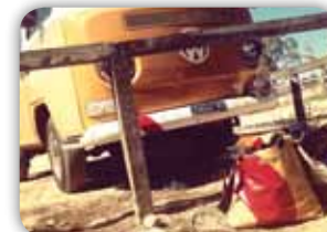
ORIGINÁLNÍ TAŠKY Z AUTOPLACHET MUSTACHES 4