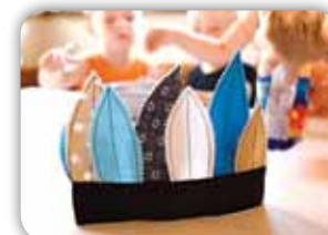
INDIÁNSKÁ ČELENKA 22 Z BAREVNÝCH LÁTEK