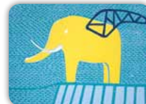
NÁVŠTĚVA TISKAŘSKÉ DÍLNY 14 BARBORY HEŘMANOVÉ