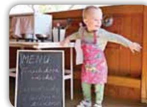
VÝROBA SNOVÉ DĚTSKÉ KUCHYŇKY NA HRANÍ