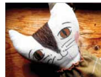
Hračky, dekorace a maličkosti ze dřeva, textilu a ovčího rouna – Kateřina Jurášová / www.fler.cz/chalupa-dobromysl