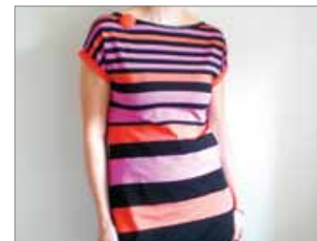
Veselé a hravé věcičky k rozzáření všedních dnů – Lucia Fabiánová / www.fler.cz/cabesita