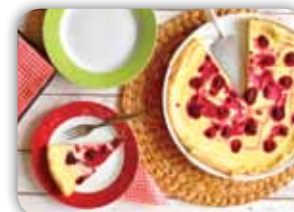
TVAROHOVÝ KOLÁČ S MALINAMI