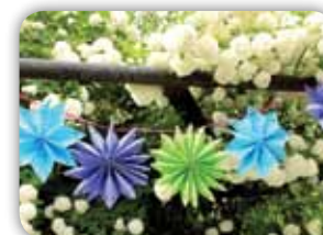
PAPÍROVÉ KVĚTY – NEJRYCHLEJŠÍ VÝZDOBA