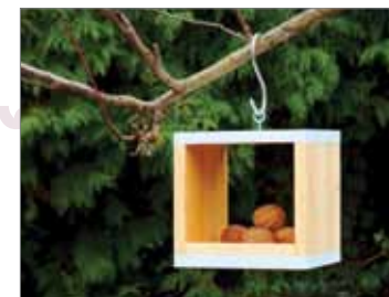
Ručně vyráběné originální ptačí budky, hmyzí hotely a krmítka – Boleslav Tomšík / www.dilnahammer.cz