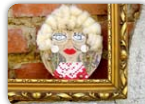
ORIGINÁLNÍ TEXTILNÍ KOLÁŽ – PORTRÉT 10