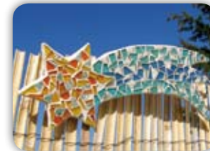
MOZAIKOVÁ KOMETA NA ŠPICI VÁNOČNÍHO STROMKU 6