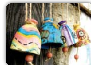
ORIGINÁLNÍ ODLÉVANÉ 19 ZVONKY Z DÍLNY EFKOART