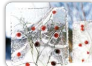
ZÁBAVNÉ LEDOVÉ TVOŘENÍ 16 PRO MRAZIVÉ DNY