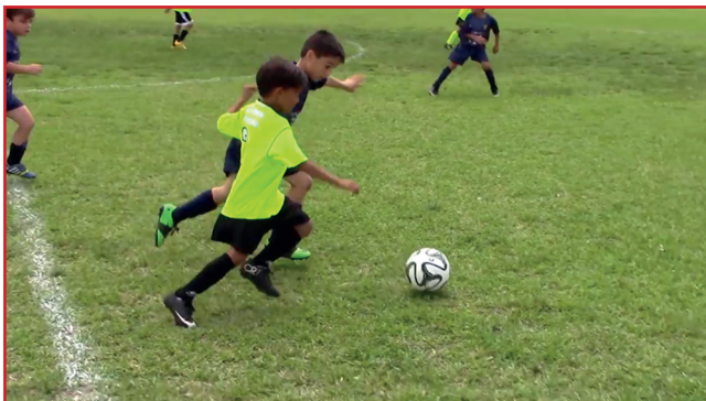
Deti hrajúce futbal.

Keď už ste zúžili výber len na niekoľko tém, zamyslite sa nad tým, ako každú z nich uchopiť. Pri niektorých sa ponúka hneď niekoľko možností. Povedzme, že máte radi futbal a chcete o ňom spustiť kanál.