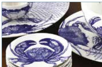
Studio Caskata, Sherborn, Massachusetts