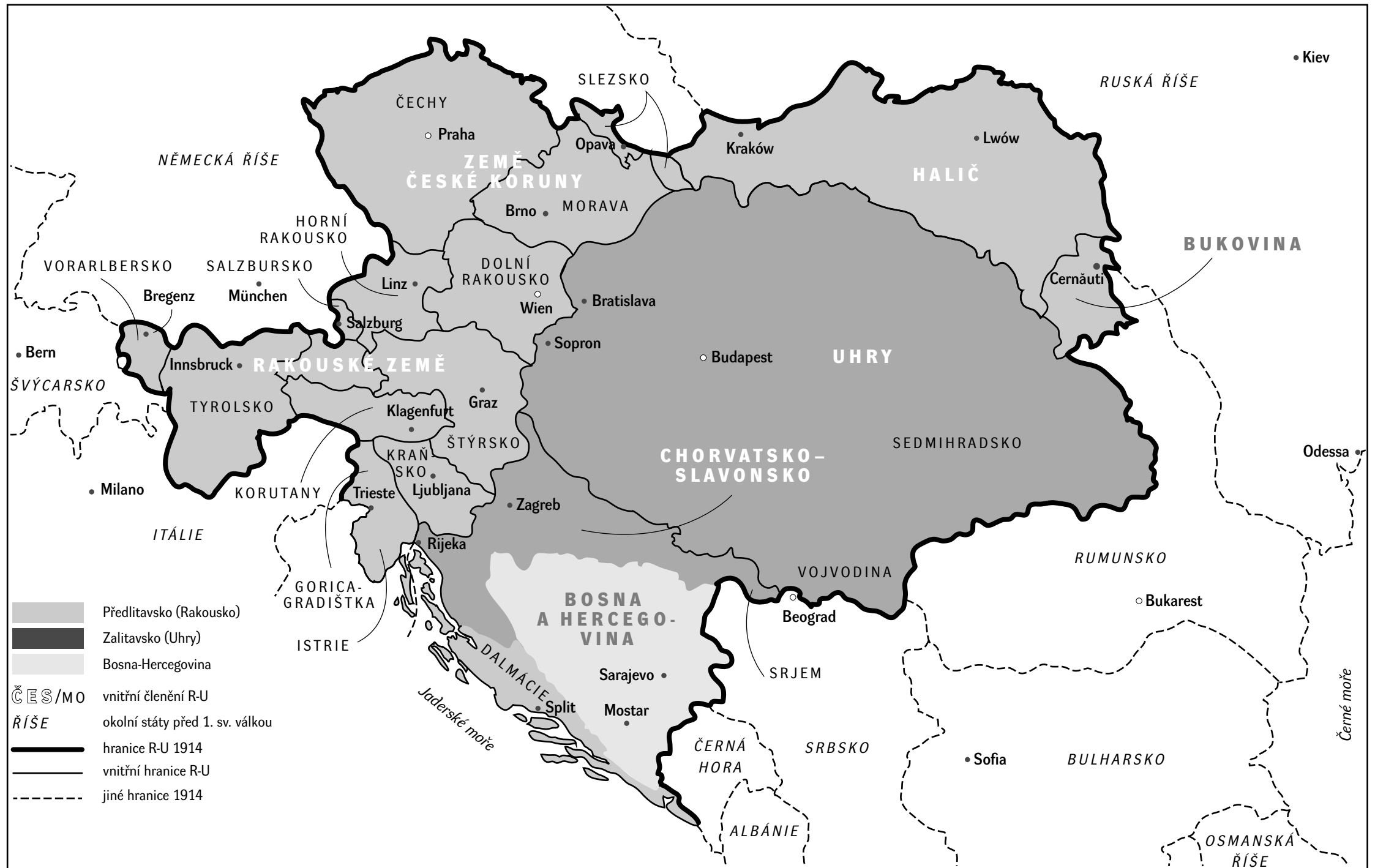
Rakousko-Uhersko před první světovou válkou