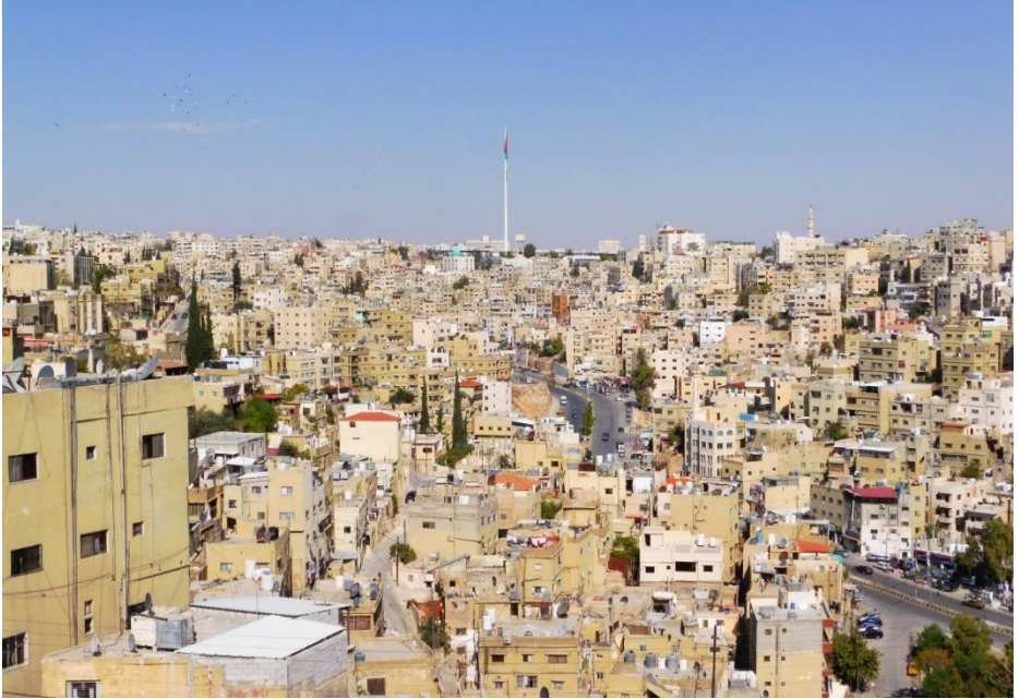
Ammán a jeho bílé domy

na jednom z mnohých kopců. Biblický příběh o Mojžíšovi si pak můžete připomenout na posvátné hoře Nebo. Odpočinout si můžete u Mrtvého moře, které je nejnižším místem na celé Zemi.