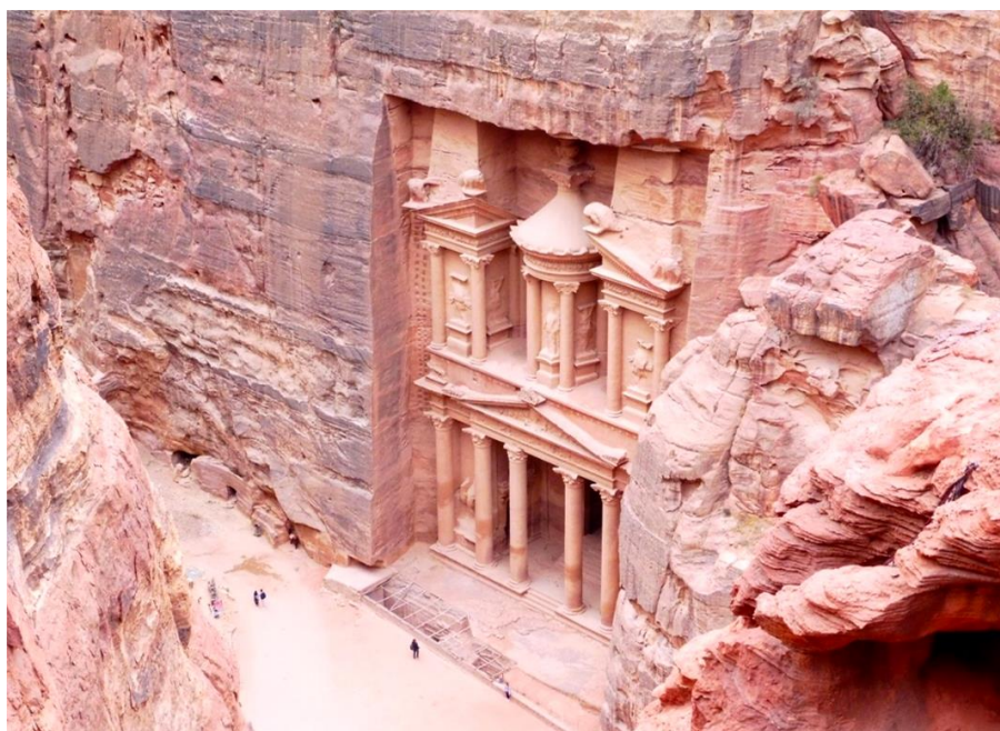
Do Petry vás dopraví ranní autobus z Ammánu. A protože je turistický, jede přímo ke vchodu do areálu.

Alternativou k turistickému autobusu Jett jsou lokální minibusy. Ty odjíždějí z centra Ammánu. Tahle doprava má jeden zádrhel. Neexistuje žádný jízdní řád, jednoduše přijdete, najdete si vozidlo mířící do Petry, zaplatíte, usadíte se a čekáte, až se všechna místa obsadí. Poté se může vyrazit.