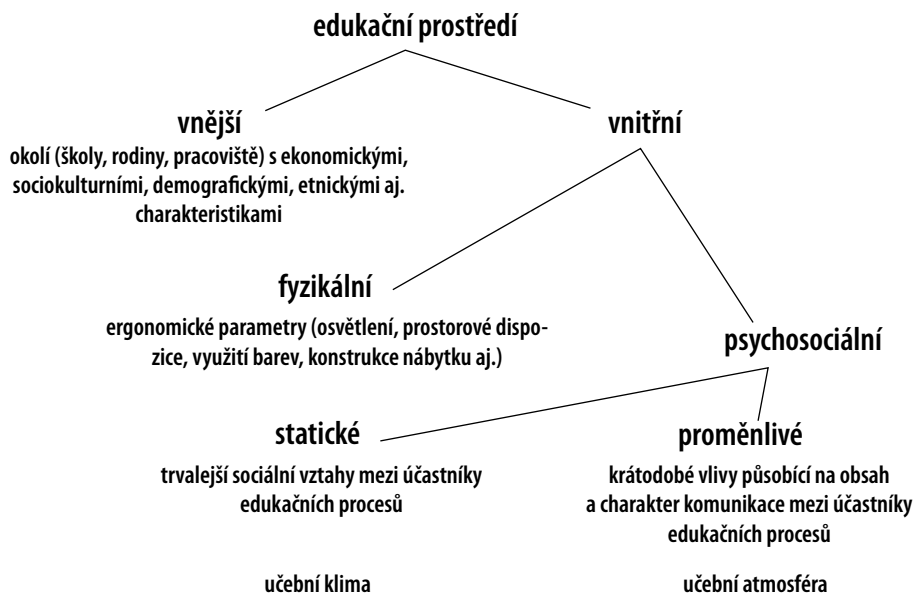
Obr. 1 Edukační prostředí v pojetí moderní pedagogiky (Průcha, 2013, s. 70)

Jako poslední je třeba zmínit ještě učivo , coby obsah či náplň edukace a učení , jako samotné osvojování si vědomostí a dovedností, tj. činnost edukanta. V. Kulič (1992, s. 32) definuje učení jako „proces, v jehož průběhu a důsledku mění člověk svůj soubor poznatků o prostředí přírodním a lidském, mění své formy chování a způsoby činnosti, vlastnosti své osobnosti, a obraz sebe sama. Mění své vztahy k lidem kolem sebe a ke společnosti, ve které žije – a to vše směrem k rozvoji a vyšší účinnosti.“ Pro realizaci edukace je důležité si uvědomit, že stejně jako každý edukátor inklinuje k nějakému stylu výuky, tak edukant má do jisté míry vrozený styl učení, tj. preferovaný postup při učení. Tento částečně vychází z našeho kognitivního stylu, ale v průběhu vývoje dochází k jeho proměnám (záměrným i nezáměrným). Mezi tyto patří např. auditivní, vizuální, kinestetický apod. (Hanušová, 2007). Pro zjištění učebních stylů existují standardizované dotazníky, ale pro potřeby edukace v ošetrovatelství můžeme použít také rozhovor, případně pozorování průběhu činnosti pacienta (Mareš, 1998).