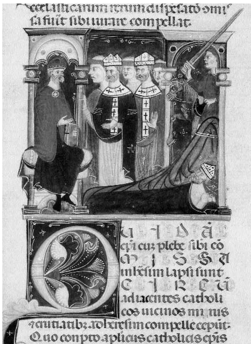
1. Světská moc zasahuje proti biskupům upadnuvším do kacířství. Franciscus Gratianus de Garratoribus, Decretum, Itálie, Bologna, konec 13. stol. Praha, Knihovna Národního Muzea XII A 12, fol. 204r.