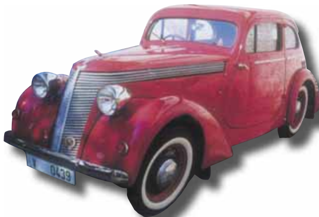
OBR. 3 V KVASINÁCH SPATŘIL SVĚTLO SVĚTA TAKÉ OSOBNÍ VŮZ JAWA MINOR I