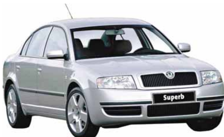
OBR. 7 NEJVĚTŠÍ AUTOMOBIL ZNAČKY ŠKODA – SUPERB – SI ZÍSKÁVÁ STÁLE VĚTŠÍ OBLIBU

„Superb znamená víc než jen volnost pohybu, znamená také svobodu myslí,“ říká slogan současného prospektu na vůz, s nímž se na příštích stránkách této publikace seznámíte (OBR. 7).