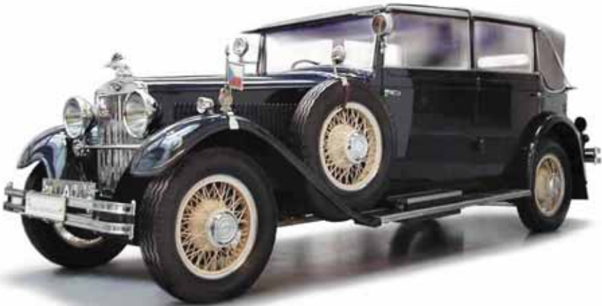
OBR. 1 MOHUTNÝ CHLADIČ, NEZVYKLÝ NÁRAZNÍK A PŮSOBIVÁ KOLA S DRÁTOVÝM VÝPLETEM, TO BYLA ŠKODA 860, PŘEDCHŮDCE SUPERBU

Dalo by se říci, že vše začalo u modelu Škoda 860. Velice reprezentativní model byl vyráběn v letech 1929 až 1932, přičemž jeho označení 8 znamenalo osmiválec, označení 60 potom maximální výkon v koních (44,1 kW) při 3000 min -1 . Majestátná 5425 mm dlouhá limuzína dosahovala rychlosti až 110 km/h a brány továrny postupně opustilo 49 vyrobených vozů (OBR. 1).