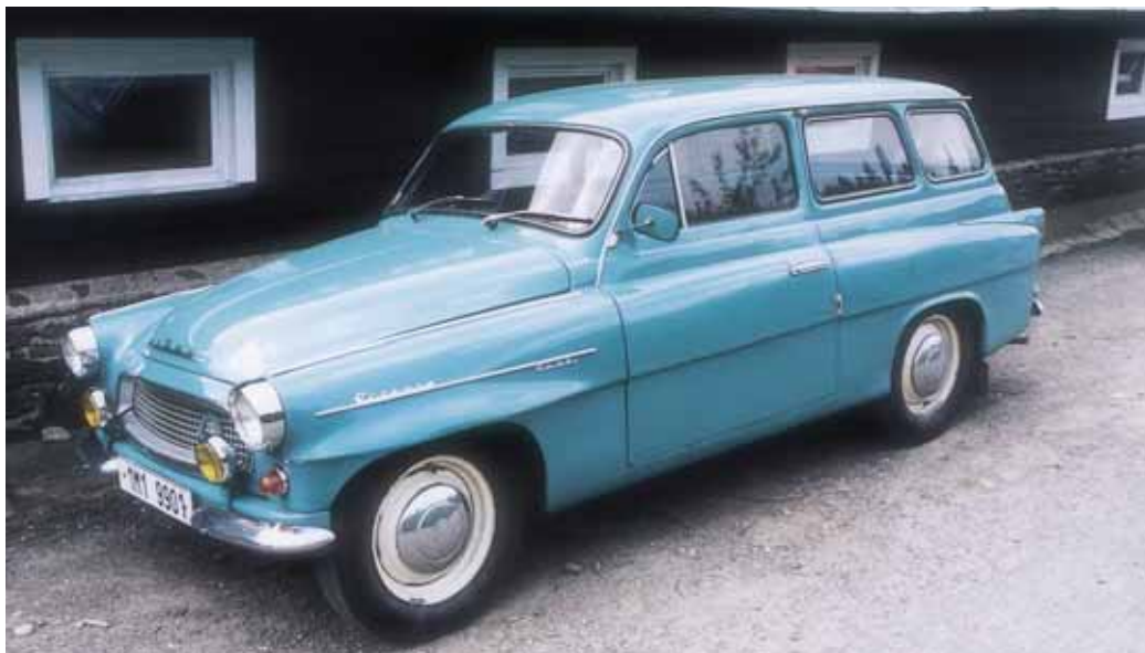
OBR. 5 BRANAMI KVASINSKÉHO ZÁVODU PROJELO 50 237 VOZŮ ŠKODA OCTAVIA COMBI

vyřáběný i pod koncernovou značkou Volkswagen (dalších 18 952 vozů). Až do výběhu řady Felicia se v Kvasínách vyrobilo 50 099 hatchbacků, 2399 Combi a 5147 užitkových VanPlus. Poslední Pickup vyjel z továrny 27. října 2000 a nesl označení VW Candy. V té době běžela první série karoserií Fabia (A04) a 20. dubna 2001 byla ukončena výroba Felicií (A02). V Kvasínách už zůstala jen specializovaná výroba karoserií Fabia Sedan ve svařovně pro finální montáž v Mladé Boleslavi.