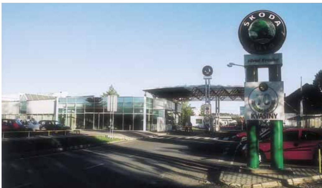
OBR. 6 ZA BRANAMI REKONSTRUOVANÉ TOVÁRNÍ V KVASÍNÁCH SE RODÍ SOUČASNÁ CHLOUBA AUTOMOBILKY

vyřáběný i pod koncernovou značkou Volkswagen (dalších 18 952 vozů). Až do výběhu řady Felicia se v Kvasínách vyrobilo 50 099 hatchbacků, 2399 Combi a 5147 užitkových VanPlus. Poslední Pickup vyjel z továrny 27. října 2000 a nesl označení VW Candy. V té době běžela první série karoserií Fabia (A04) a 20. dubna 2001 byla ukončena výroba Felicií (A02). V Kvasínách už zůstala jen specializovaná výroba karoserií Fabia Sedan ve svařovně pro finální montáž v Mladé Boleslavi.