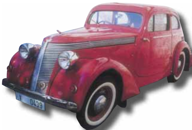
OBR. 3 V KVASINÁCH SPATŘIL SVĚTLO SVĚTA TAKÉ OSOBNÍ VŮZ JAWA MINOR I