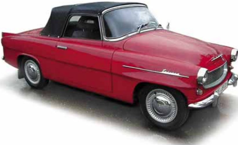
OBR. 4 ŠKODA FELICIA PATŘÍ I PO MNOHA LETECH K NEJKRÁSNEJŠÍM SPORTOVNÍM VOZŮM ŠKODA

Na přelomu padesátých a šedesátých let se závod Škoda v Kvasinách proslavil výrobou vozů Škoda 450 Felicia (OBR. 4) a Škoda 445 Octavia Combi. Ty vycházely z modelového typu Škoda 440 (970), populárního Spartaka, který byl původně představen jako vývojový mezityp pro dočasnou výrobu. Dočasnost se nakonec protáhla na deset let, a tak se automobil dočkal několika karosářských i motorářských verzí a variant. Za zmínku stojí, že jednou ze zásadních inovací, který vůz, tolik oblíbený pro svoji jednoduchost a přiměřenou cenu, měl, byla přední náprava, u níž listovou pružinu nahradily dvě vinuté pružiny. Vozy řady 450 a 445 neměly prakticky na domácím trhu konkurenci, a tak nebylo divu, že jich bylo vyrobeno přes 65 000 kusů. Především sportovní Škoda Felicia byla úspěšným exportním artiklem a celá řada Škoda 440, 445, 450 vůbec dosáhla řady sportovních úspěchů. Škoda Felicia pak byla považována za jednu z nejhezčích poválečných škodovek. Řada Š 440 s jeho variantami byla posledním sériovým vozem Škoda s rámovým podvozkem, s motorem vpředu a pohonem zadních kol. Do roku 1964 bylo v Kvasinách vyrobeno 15 862 kusů roadsterů Felicia/Felicia Super a celkem 50 237 vozů Octavia Combi (OBR. 5).