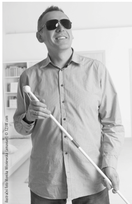
Ilustrační foto Monika Winiarska (amadej) © 123RF.com

A tak se sám sebe ptám: Co je víc? Kristus sám, nebo Kristus, kterého jsem si vymodeloval? Kdo je skutečný a živý Bůh, a kdo je jen jeho karikatura? Je Ježíš, ve kterého věřím, Ježíšem reálným? Je skutečně tím, kterého zjevuje