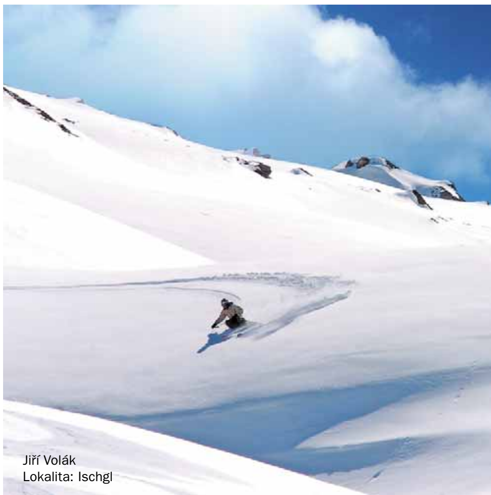
Jiří Volák Lokalita: Ischgl

převážně mimo sjezdovky, v lesích a na všelijak zvlněných zasněžených pláních. Používá se při něm speciálních lyží, které jsou širší a delší než lyže klasické, určené na sjezdovku.