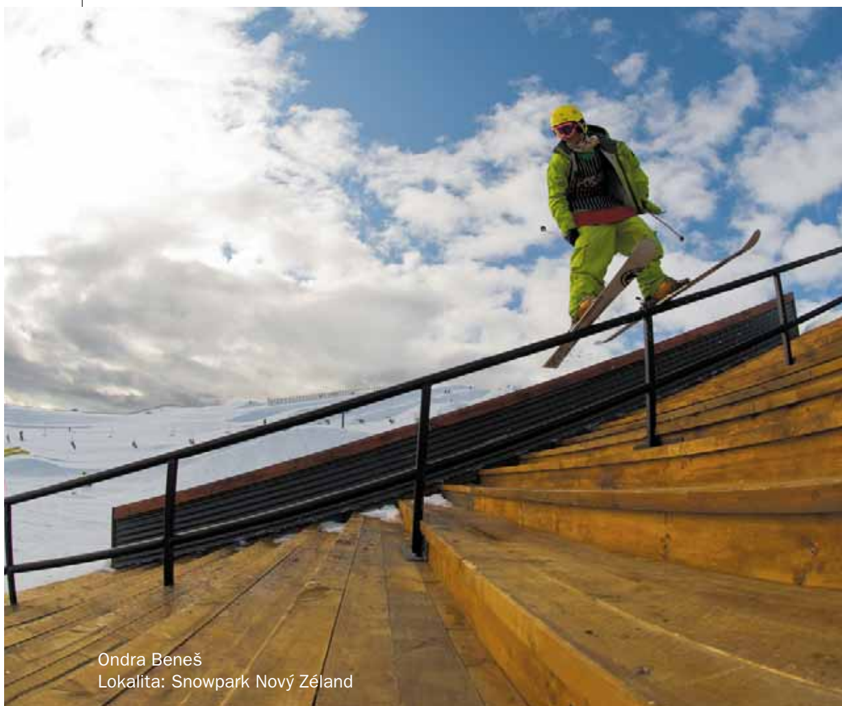
Ondra Beneš Lokalita: Snowpark Nový Zéland

vytvořených překážkách ve snowparcích a na tzv. „street jibbing“, ježdění v ulicích měst po zábradlích apod. Bezpečnější a mnohem rozšířenější je samozřejmě jibbing ve snowparku, pro který je určen nespočet překážek různých tvarů a velikostí. Jejich přehled najdete v kapitole věnované jibbingu