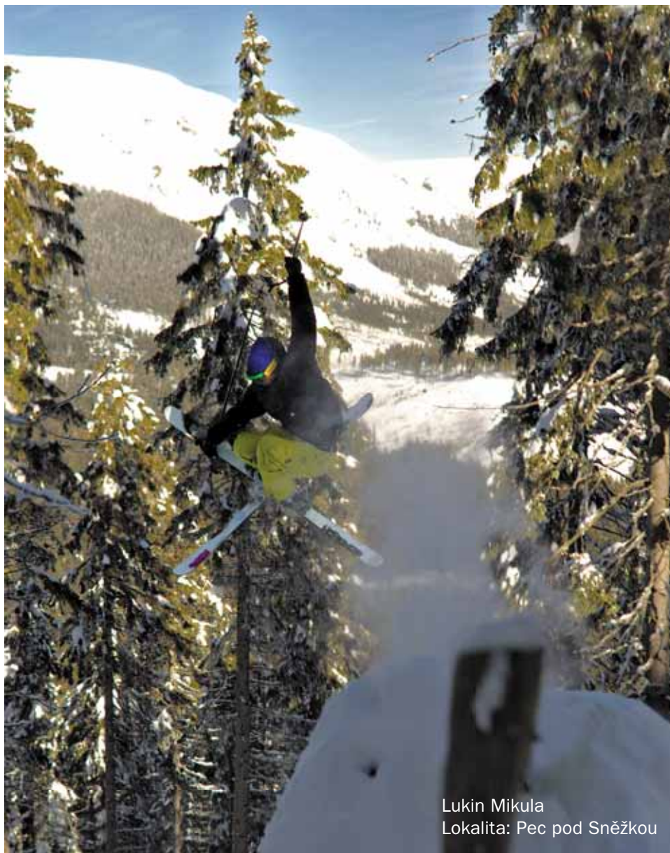
Lukin Mikula Lokalita: Pec pod Sněžkou

se také využívá ke stavbě skoků s přistáním přímo do neupraveného dopadu. Backcountry terény jsou často vhodné pro učení se novým trikům, právě díky měkkému dopadu. Skoků do neupravených terénů se pro jejich popularitu a diváckou atraktivitu často využívá při natáčení profesionálních freeski filmů.