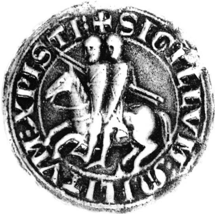
Templářská pečeť s typickým motivem dvou jezdců na jednom koni