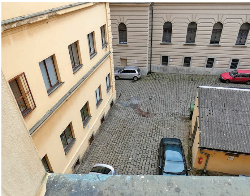
Pohled z badatelny SOA v Plzni do malého dvora KS, kde probíhaly popravky.

překlepů v textech zaznamenaných na psacím stroji. Jistým nedostatkem bylo, jak již uvedeno, dosti časté komolení příjmení. Autor je si vědom, že se ojediněle neubránil použít či parafrázovat český jazyk, používaný v době retribučního soudnictví a působící dnes již poněkud archaicky, byť se tomuto stylu snažil všemožně vyhnout. V porovnání s dnešní praxí, s níž má zkušenosti z práce soudního znalce, konstatuje, že při časově limitované praxi MLS dokumentace těchto institucí nijak nezaostávala, spíše naopak. 37 Koneckonců zkoumané MLS působily při krajských soudech.