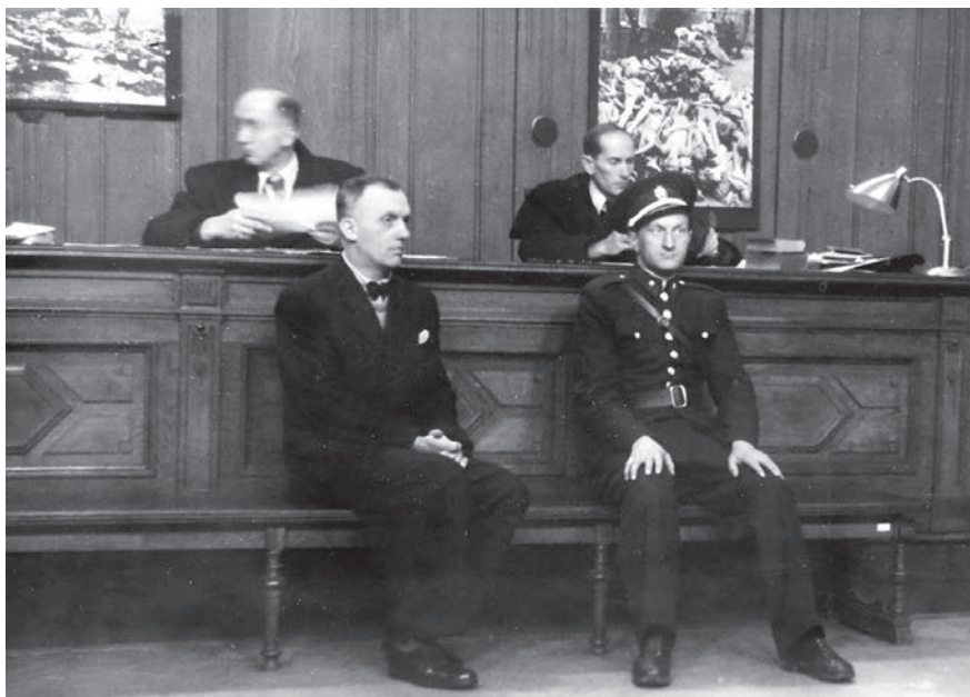
Soudy s příslušníky Gestapa.