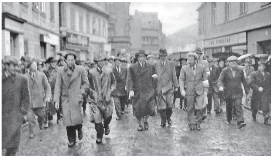
Členové revolučního národního výboru v Sušici se vracejí z úspěšného jednání s Němci o převzetí moci ve městě z hotelu Svatobor.

době vnesen v rámci retribučního soudnictví a ani zapříčiněn podle zneužití tzv. malého retribučního dekretu žádný hrdelní trest. Přesněji řečeno, litera malého retribučního dekretu to ani neumožňovala, neboť tento zákon měl řešit jen provinění menší závažnosti. Nicméně u jiných soudů se však ještě tu a tam stalo, že komunistickému režimu nepohodlná osoba se na základě malého retribučního dekretu dostala za mříže a pak si s ní již komunistická pseudospravedlnost poradila uplatněním postupů, známých z monstrprocesů a dalších vykonstruovaných a zmanipulovaných procesů konce čtyřicátých a počátku padesátých let. 21 Proto sonda a kniha končí ortely vnesenými těsně před 4. květnem 1947, přičemž však ještě sleduje osudy těch několika málo zločinců, kteří navrženým nebo již uloženým trestům smrti nějakým způsobem unikli.