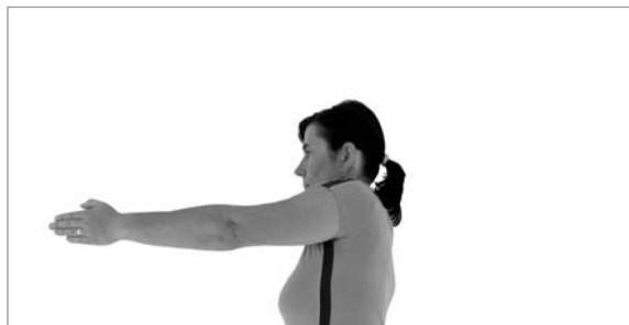
Chybný pohybový stereotyp předpažení