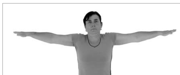
Chybný pohybový stereotyp upažení