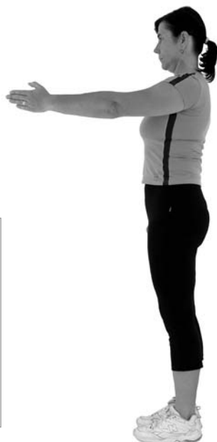
Správný pohybový stereotyp předpažení