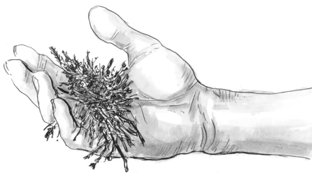
Obr. 3 Materiál je příliš suchý

Orientační zkouška v praxi zcela postačí!