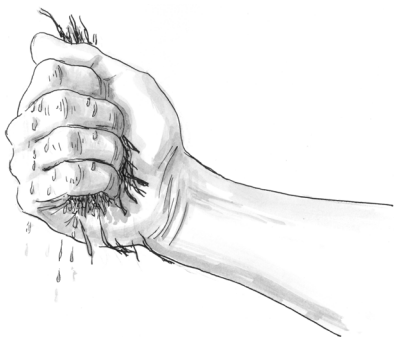
Obr. 4 Materiál je příliš vlhký