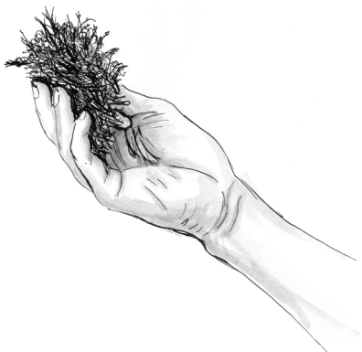
Obr. 2 Optimální vlhkost materiálu

Když je materiál příliš vlhký, objeví se při zmáčknutí voda mezi prsty; pokud lze vymáčknout více než jednu kapku vody, je materiál již příliš vlhký (obr. 4).