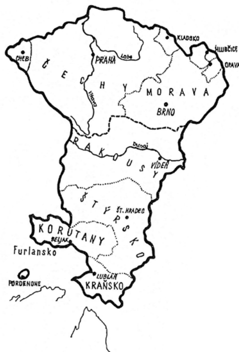
Obr. 2 Rozsah českého státu za panování Přemysla II. Otakara. Převzato z literatury [8]

o vznik zemských desek jako mimořádného nástroje k evidenci některých věcných práv k šlechtickému majetku; vzhledem k jeho významu se budeme tímto nástrojem podrobně zabývat později.