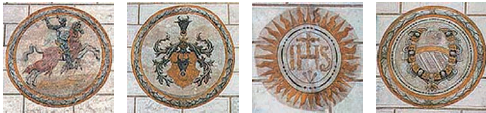
Vývoj znaku města Český Krumlov