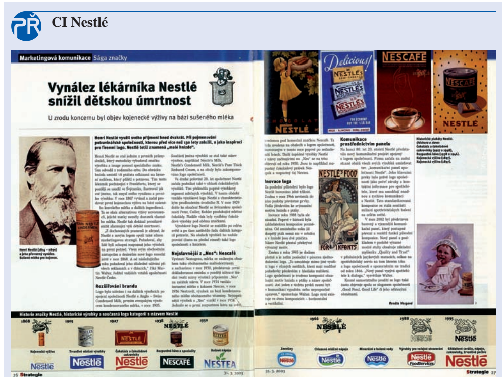
Obr. 1.1 CI Nestlé

nikde nebyl název cigaret, jen kontura rudé a bílé barvy z jejich obalu. Všichni věděli, o koho jde. Auta jedoucí v těchto barvách tehdy slavně zvítězila. Vizualní identita může tedy mít i zkratkovou podobu. Chce to ovšem dlouhodobě investovat. Nadnárodní firmy doslova válčují národní trhy, ale nemusejí být konečným vítězem – každá akce budí reakci. Reakcí na globalizaci je zdůrazňování národní identity, koloritu, kultury. Mnozí naši politici si tuto skutečnost neuvědomují. Nebojte se jít do střetu se silnými; i Goliáš byl poražen. Chce to ovšem mít na čem budovat svoji pověst. Základem komerčních komunikací je v každém případě dobře vymyšlený vizualní styl jako součást celkové CI.