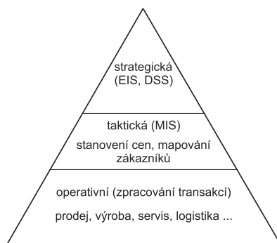
Obrázek 1.3: Hierarchické úrovně v informačních systémech