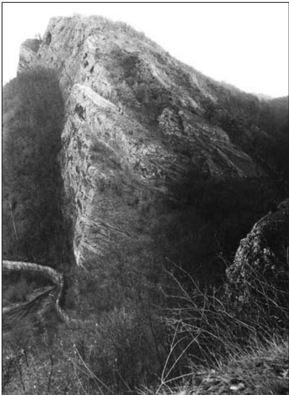
Vápencová skála ve Svatém Janu pod Skalou nese na svém temeni pravěké hradiště, jeskyni a kříž, pod kterým K. H. Máchá napsal svou první publikovanou báseň. Je to příklad tvrdé skalnaté krajiny uprostřed okolní měkké zemědělské krajiny.