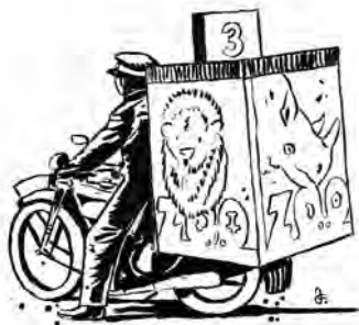
Reklamní motocykl, za nímž se Pražané ohlíželi.

Lze tedy skutečně považovat za malý zázrak, že se navzdory těmto těžkým podmínkám podařilo dne 28. září 1931 pražskou zoo otevřít pro veřejnost.