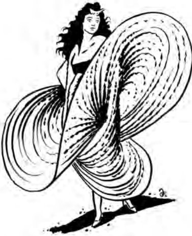
Baletka Fullerová a alespoň jedna variace jejich proměnlivých šatů.

stávaly různou podobou, zvýrazňovanou navíc díky šikovým osvětlovačům.