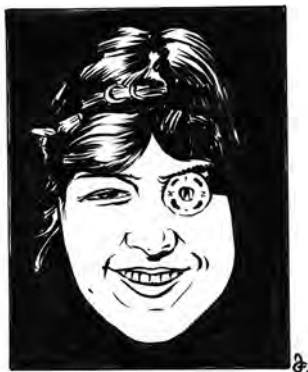
Waldesovo logo miss KIN.

V roce 1903 sestrojil přemýšlivý Hynek Puc tzv. zakladačku, což byl přístroj, nahrazující dosavadní ruční montáž patentky pomocí pinzety a konající práci za deset zručných dělnic. Tím se logicky mohla zvýšit výroba, takže firma