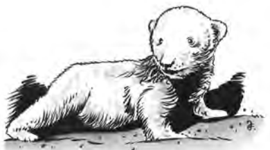
Nejslavnějším okupačním přírůstkem se stala medvědice lluna zvaná Sněhová vločka.

V tomto období samozřejmě platilo, že v zoo nejenže nesměly pracovat osoby neárijského původu, ale zahrada měla zakázány i nákupy zvířat od takto ocejchovaných prodejců. Návštěvnost sice poklesla na úroveň poloviny 30. let, ale ročně prošlo vstupní branou 300 až 420 tisíc lidí. Aby nebylo nutno „drasticky snižovat stavy zvířat, a to ani těch náročnějších“, pěstovali zaměstnanci pro část chovanců krmivo