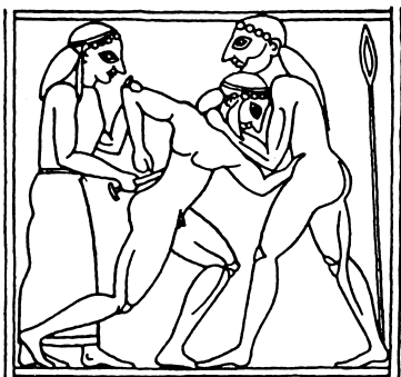
Zavraždění Agamemnona. Klytaiméstra vráží meč do Agamemnona, kterého drží Aigisthos.

Agamemnón zavraždil Thyestova syna Tantalova i novorozeného syna Klytaiméstry. Donutil vdovu po Tantalovi, Klytaiméstru, aby se za něj provdala. Jejich dětmi byly dcery →Ifigeneia, Chrysothemis a →Elektra a syn →Orestés. Agamemnón se stal králem v Mykénách a jedním z nejmocnějších vládců na Peloponnésu.