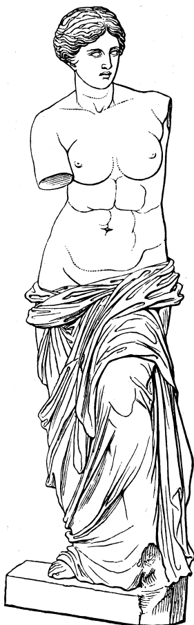
Socha Afrodity z Mélu