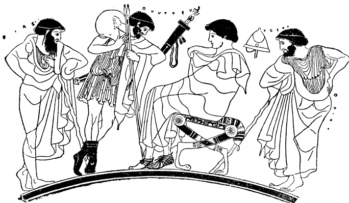
Odysseus opřený o kopí přemlouvá sedícího Achillea, aby pokračoval v boji. Za Odyssem stojí Aias, za Achilleem Foinix.

řečnictví a ovládnání zbraní. Vychováván byl také u moudrého kentaura Cheiróna (živil ho jenom vnitřnostmi lvů a kanců), kde se rovněž vyučil lékařství.