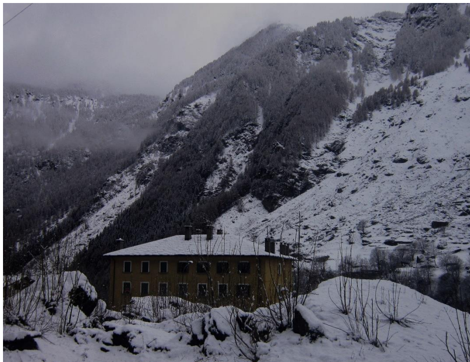
Starý hotel Oriental v Prestone v Campodolcinu

Těžké šedé mraky visí na obloze a vypadají, jakoby se chtěly každou chvíli zřítit. Okolní skalní štíty střídavě vystupují z nakupených mračen jako hrozné temné přízraky. Jakmile se v tomto počasí začnou z rokle od Chiavenny nahoru plížit obrovské chuchvalce mlhy, je jasné, že do kraje přichází zima. Cáry mlhy stoupají rychle a bývají tak husté, že horalé z výše položených vesnic