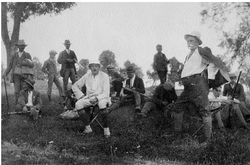
Karel Kramář na honu

„ ovšem bez těch 100 zlatých “, jak později podotknul. 22 Přes všechno vynaložené úsilí se právníčině ve smyslu práce v advokátní kanceláři nebo u soudu nikdy nevěnoval. Celý život se ale účastnil tvorby zákonů, ať již v Rakousku-Uhersku nebo pak v Československu. Svěho doktorského titulu si nesmírně vážil a byl na něj hrdý. O tom, jak na něm lpěl, svědčí i úsměvná historka z honu. Kramáře kdysi jeden z účastníků oslovil „pane poslanče“. Kramář ho hned zarazil se slovy, že tady, na honu, je přece mezi svými, takže tady je jen „doktor Kramář“.