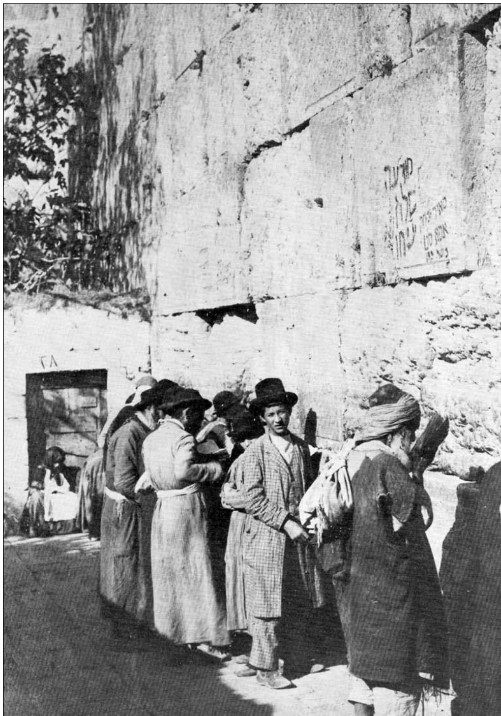
Židé se modlí u Zdi nářků (konec 19. století)