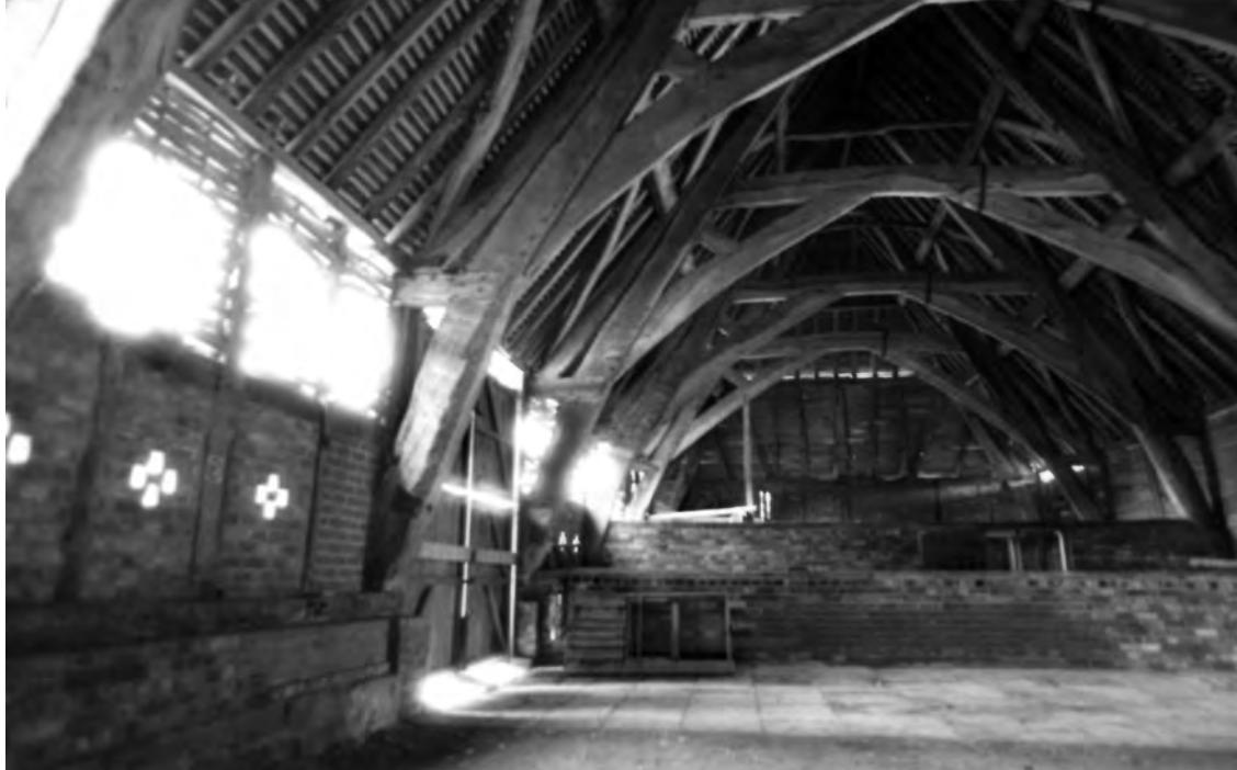
Stodola, Leigh, Worcestershire, 14. stol.; GB