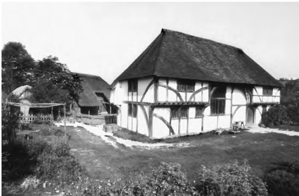
Hrázděný dům z Bayleaf, 1405, W. Sussex; M-Singleton, GB

Dortmundu), také například na stodolách ze západorumunského pohoří Meseş. Zřejmě o jejím skutečném historickém rozšíření víme ještě málo.