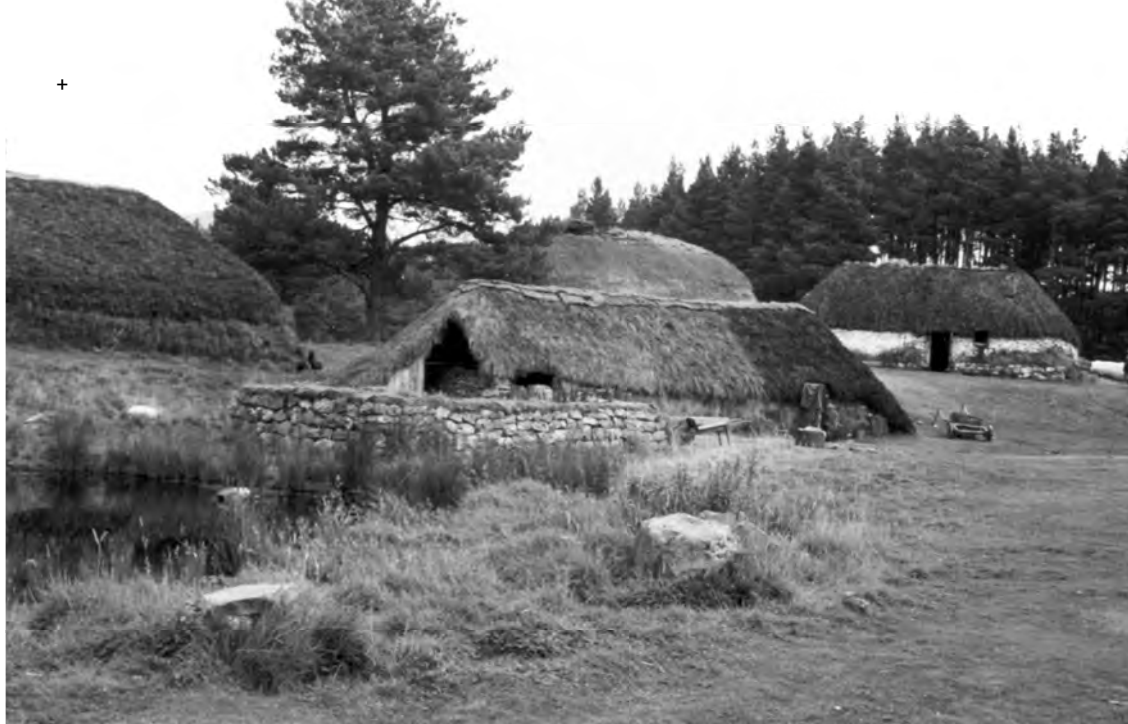
Rolnická osada ve Skotské vysočině; M-Newtonmore, GB

novce, kapradí, vřesu či rákosu, které rostly poblíž. Byla to již vyspělá konstrukce anglicky nazývaná cruck , francouzsky courbo . Dokázala překlenout 6,5 až 9,5 m a sestavit tak široký prostor. Dvojice sloupů ve výšce kolem 1,6 až 5 m přepažoval trám zvaný spona ( tie beam ), k němu byly připevněny proutěné příčky oddělující tři prostory. Na spony dvou středových párů zakřivených sloupů se kladl trámek sloužící k zavěšení kotle, konvice nebo kovaného kruhovitěho roštu na grilování nad ohništěm. Pro únik dýmu byl dřevem a hlinou upraven