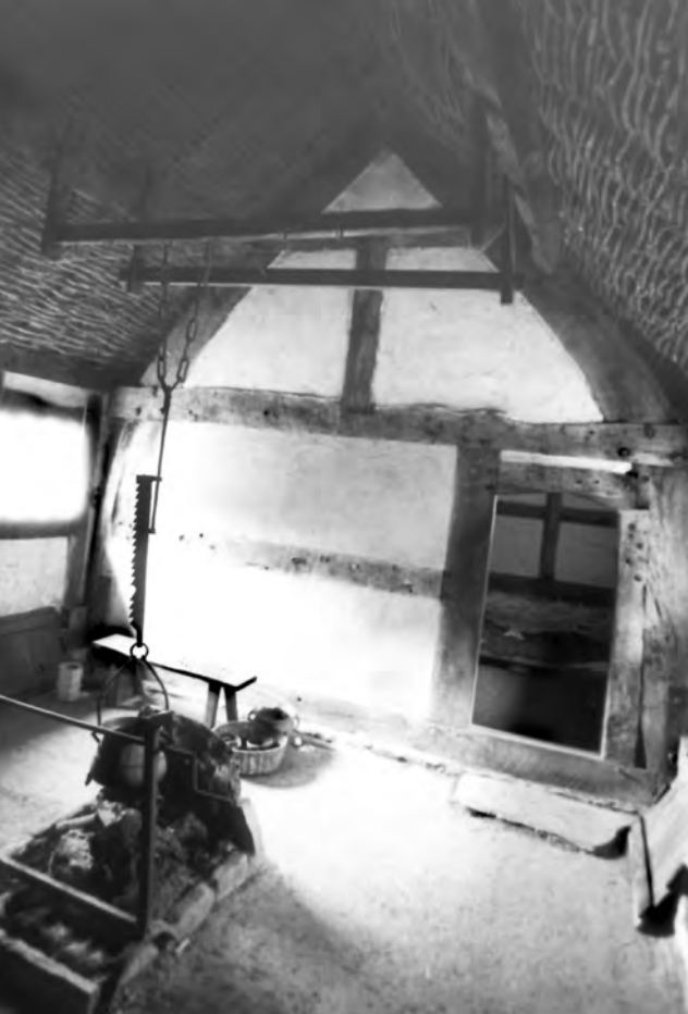
Obytná kuchyně domu z Llangynhafal z r. 1508; M-St. Fagans, GB

forma stavby se považovala za náročnější než prosté rámy hrázdění. Používala se i na architektonicky komplikovaných domech. Zakřivené sloupy totiž mohly překlenout širší prostor než tehdejší konstrukce sedlových střeš uložených na palisádových, rámových nebo hrázděných stěnách. V dalším vývoji stěny získaly větší prestiž pro svoje mnohotvárné možnosti. Zakřivené dubové trámy se však používaly dále na mnohé vzpěry, spony, hambálky a jiné prvky staveb. V severozápadní Evropě dokonce vznikla tradice záměrného pěstování dubů s patřičně ohýbanými větvemi během mladé etapy růstu, dřevo sloužilo až druhé nebo třetí generaci. Tradice staveb se zakřivenými sloupy je známá také z francouzské Normandie, Bretaně a kraje Limousin, z Nizozemí a fríského pobřeží Severního moře, z německého Porurí (např. v raněstředověké lokalitě Westick u města Kamen na východě aglomerace