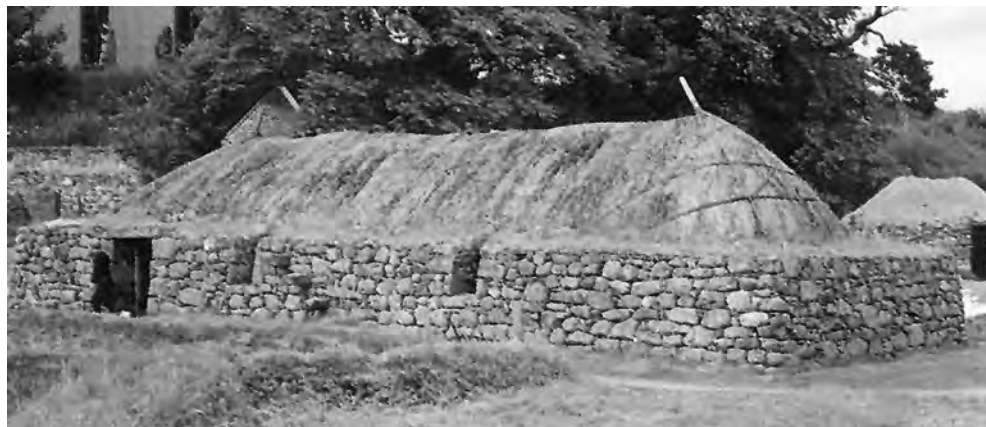
Dům z ostrova Lewis, Hebridy; M-Kingussie, GB