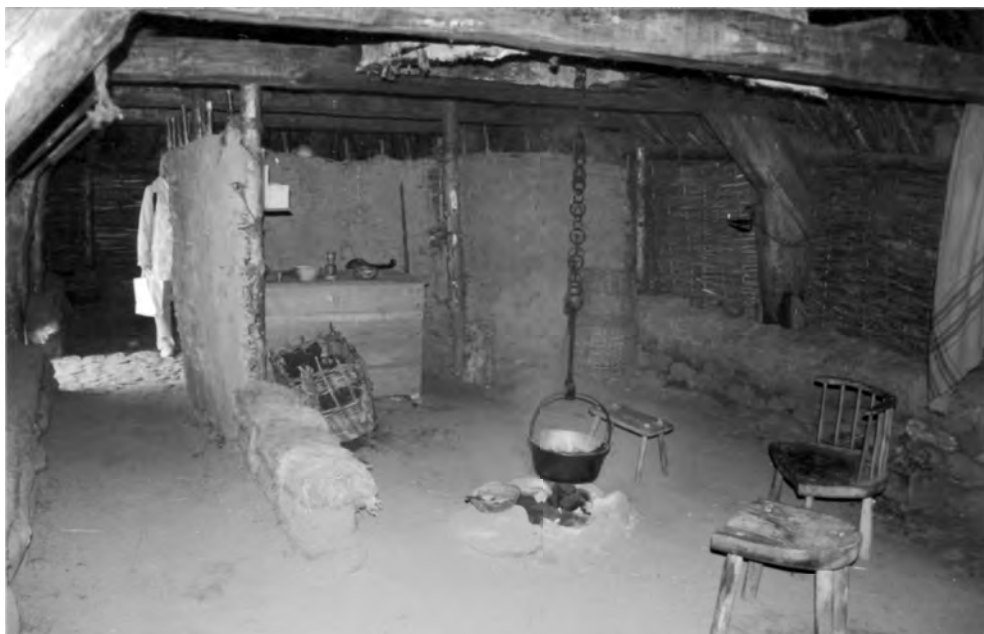
Ohniště ve střešním domě. Skotsko: M-Newtonmore, GB

novce, kapradí, vřesu či rákosu, které rostly poblíž. Byla to již vyspělá konstrukce anglicky nazývaná cruck , francouzsky courbo . Dokázala překlenout 6,5 až 9,5 m a sestavit tak široký prostor. Dvojice sloupů ve výšce kolem 1,6 až 5 m přepažoval trám zvaný spona ( tie beam ), k němu byly připevněny proutěné příčky oddělující tři prostory. Na spony dvou středových párů zakřivených sloupů se kladl trámek sloužící k zavěšení kotle, konvice nebo kovaného kruhovitěho roštu na grilování nad ohništěm. Pro únik dýmu byl dřevem a hlinou upraven