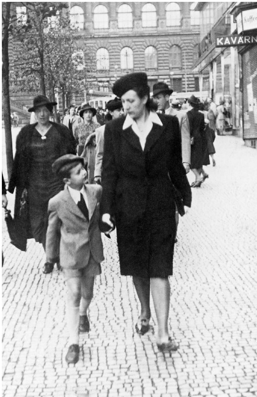
S maminkou na Václavském náměstí