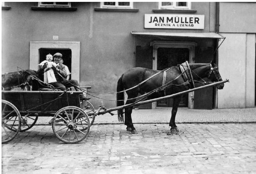
Na dědově bryčce