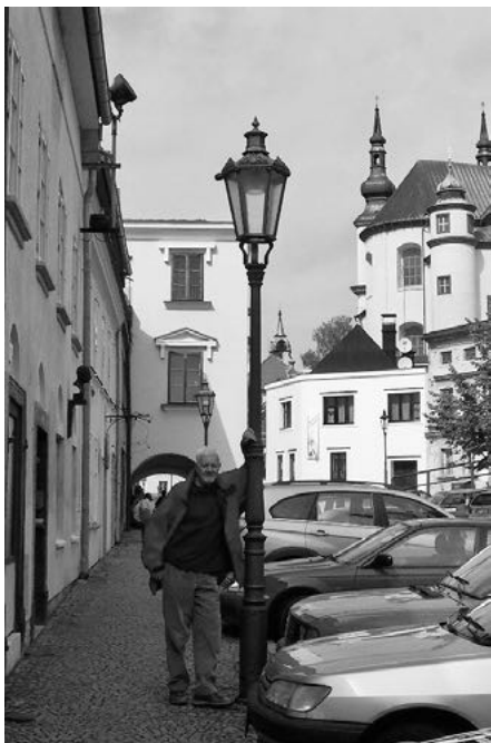
Před dědovým domem, 2010

Pro malého kluka byly nezapomenutelné jízdy v bryčce. Rád vzpomínal, jak dědečka doprovázel na jeho cestách po okolních vesnicích, po statcích a menších hospodářstvích, odkud potom pokaždé přiváděli nějakou tu kravku. Babička s dědou se měli co ohánět, děda sám porážel a porcoval, společně připravovali uzeniny a střídali se za pultem. Pilná práce od rána do večera, den co den. Komunisti později řeznictví samozřejmě znárodnili, prarodičům zůstal jen byt ve stejném domě.