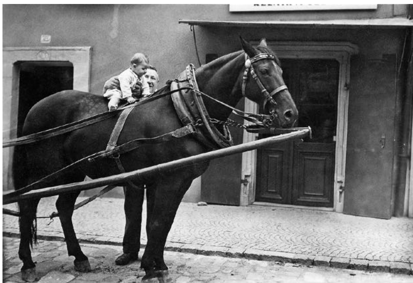
Na trpělivé kobylce