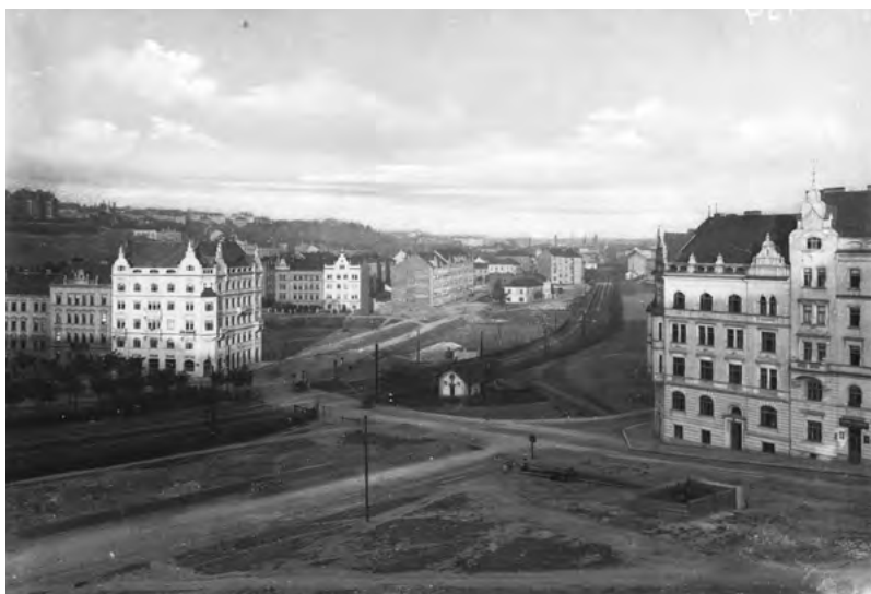
Ostrčilovo náměstí v Nuslích kolem roku 1910; uprostřed probíhá železniční trať s hradlem Vyšehrad.