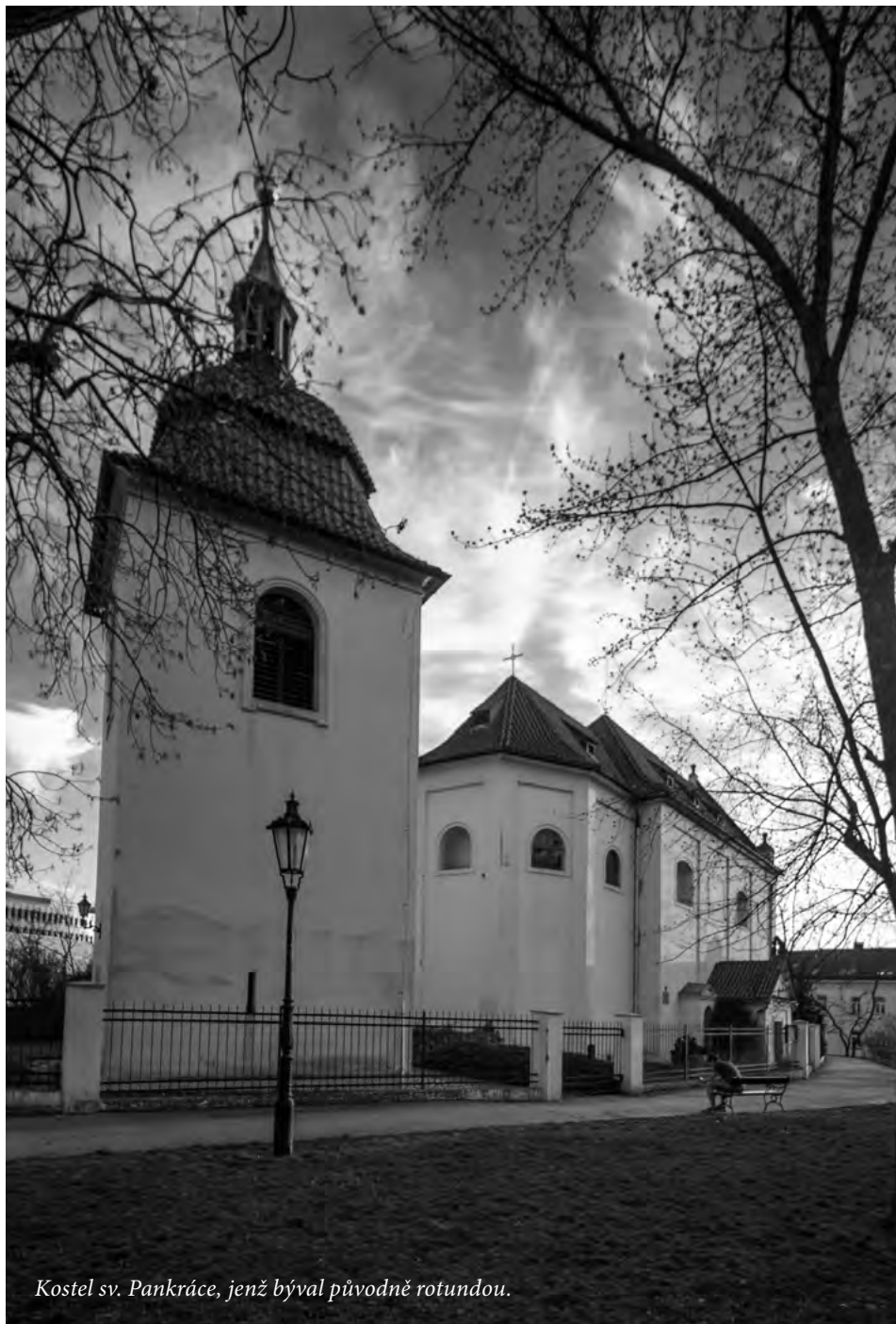
Kostel sv. Pankráce, jenž býval původně rotundou.