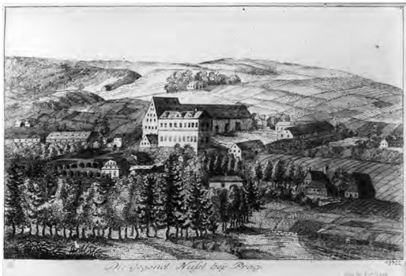
Pohled na Nuselský zámek z jihu, zhruba 1790

zahradou. Nuselský zámek byl dvoupatrový, takže není divu, že zbylo místo i na takové prostory jako taneční sál či vlastní kaple. Sloužil Vrtbům jako letní venkovské sídlo.