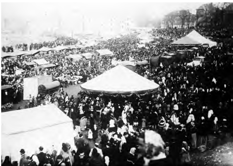
Pouť fidlovačka v roce 1900

Fidlovačka se říkávalo oblému ševcovskému nástroji . Mohla být dřevěná nebo kovová a sloužila ševcům k hlazení kůže. A podle ní byla pojmenována i ševcovská slavnost , která se konala v Nuslích každý rok po Velikonocích . Těšila se velké oblibě – a nejen proto, že Nuselské údolí bývalo v té době vyhledávaným cílem svátečních