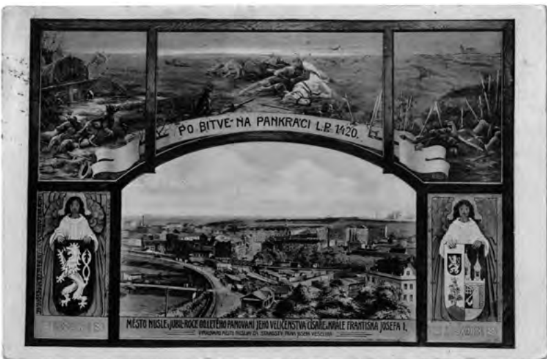
Nahoře historická pohlednice zobrazující Nuselské údolí s Karlovem v pozadí, dole pohlednice připomínající lítou bitvu husitů se Zikmundovými vojsky