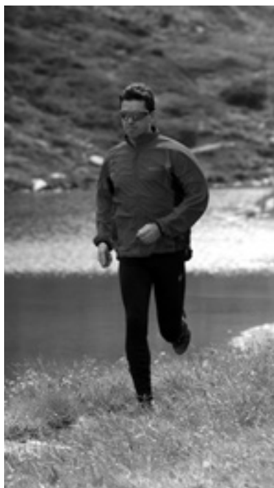
Běh jako vynikající pohybový prostředek a lék na naši psychiku

Podtrženo a sečteno: V dnešní na pohyb chudé době se stal kondiční běh ideálním kompenzačním prostředkem. Běhat lze téměř kdekoliv a kdykoliv. Běh není např. ve srovnání s cyklistikou ani příliš časově náročný. Pro dosažení stejného cíle stačí běhat výrazně kratší dobu. Je potěšitelné, že běhu u nás přichází na chuť stále více a více lidí.