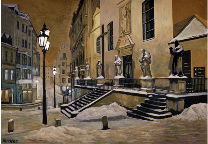
U Kapucínské krypty / Next to the Capuchin Crypt / Bei der Kapuzinergruft