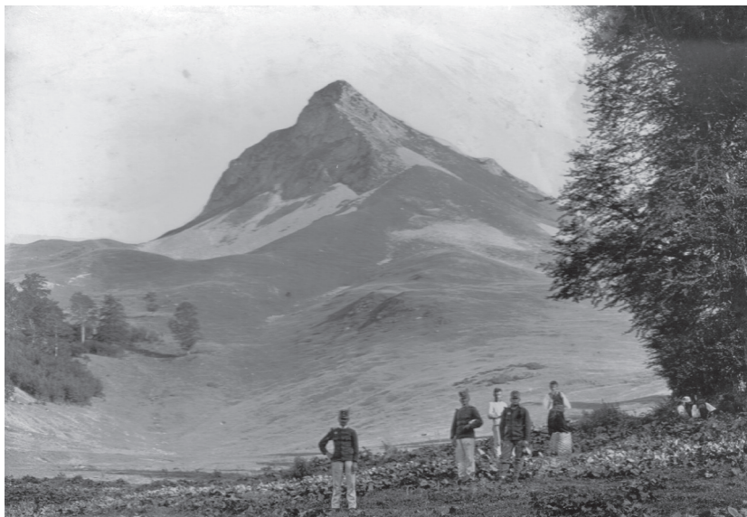
Rakouské tažení na Balkáně vypadá na tomto snímku téměř idylicky...

Nebezpečnou oblastí v Evropě a předmětem sporů byl především Balkán. V červnu 1913 zde vypukla druhá balkánská válka, v níž Srbsko, Řecko, Rumunsko a Turecko porazily Bulharsko. Po atentátu na habsburského následníka trůnu se však v centru pozornosti ocitlo Srbsko, kterému předalo Rakousko-Uhersko ultimátum, přičemž ostrý postup vůči této malé zemi podporovalo také Německo. Nakonec osmadvacátého července 1914 vyhlásilo Rakousko-Uhersko Srbsku válku, následovalo jej Německo, které obsadilo Lucembursko a vyhlásilo válku Rusku a Francii. Ohrožené Francie se zastala Británie, která vyhlásila válku Německu. Postupně bylo do války vtaženo osmatřicet států.