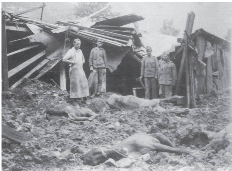
Umírali dvou- i čtyřnozí...

Na západní frontě byly vybudovány zákopy, betonové bunkry a minová pole. Postup jen o několik set metrů znamenal obrovské ztráty na lidských životech. Rakouský konflikt se Srbskem najednou ustoupil do pozadí, na jižní frontě byl až do podzimu 1915 víceméně klid, protože Srbsku se podařilo s francouzskou pomocí vytlačit nepřítele ze země, situaci zvrátil až vstup Bulharska do války na straně Ústřed-