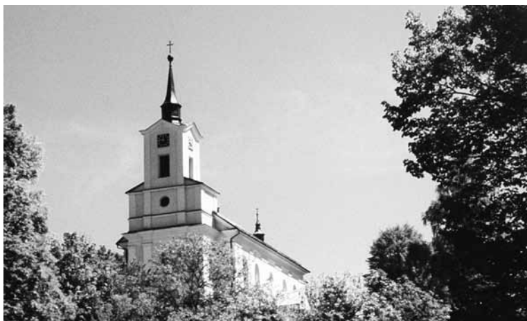
Kostel Nejsvětější Trojice v Jamném n. O. byl postaven r. 1882.