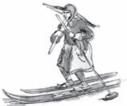
Skandinávský lyžař v šestém století

Zpočátku se pochopitelně nejednalo o lyže v té podobě, v jaké je známe dnes. Používaly se různé druhy sněžnic, které sloužily k chůzi po sněhu. Postupem času se sněžnice zdokonalovaly a chůze se sněžnicemi se měnila ve skluz na lyžích. První písemná zmínka o lyžování pochází z šestého století, kdy Procopius (526–559) psal o skriřinnar (klouzajících Finech). Seveřané zpočátku lyže využívali jako prostředek k přepravě, lovu a boji. Jejich délka byla různá, kratší lyže měla skluznou plochu pokrytou kožešinou a používala se k odrazu, delší lyže byla hladká a sloužila pro skluz. Jízda na takových lyžích se pravděpodobně podobala jízdě na koloběžce. Pro lepší udržení rovnováhy lyžař používal jedinou dlouhou tyč, kterou držel v obou rukou.