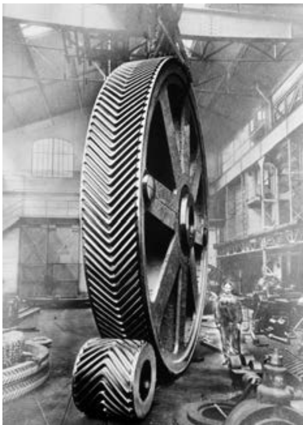
▲ Ozubená kola Citroën – tato kultovní fotografie doprovází většinu firemní literatury o historii podniku