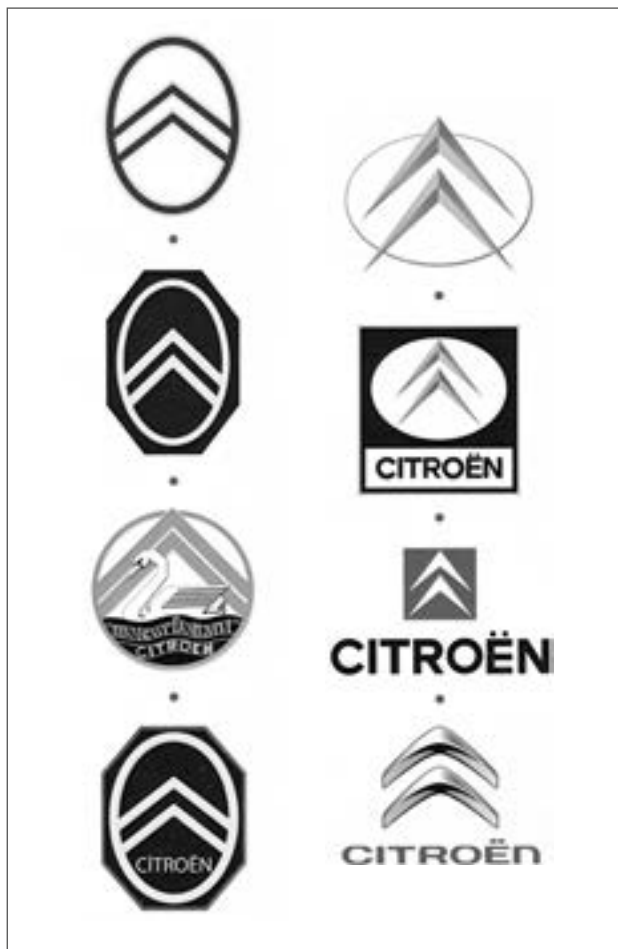
▲ Vývoj loga společnosti Citroën a její automobilové větve

žené oválem. Roku 1919 přeměrovala společnost hlavní aktivity na výrobu automobilů, které vozily stejné logo. Počátkem třicátých let se objevily nové čtyř a šestiválcové motory (v modelech 8CV, 10CV a 15CV se samonosnými karosériemi), jejichž jednou z charakteristik bylo plovcí uložení motoru, (licence Chrysler), nepřenášející vibrace pohonné jednotky do karosérie. Tuto skutečnost reflektoval i dvojitý šíp doplněný o plující labuť. Stejně logo se objevilo také na prospektech Citroënů 1,4 litru z německé filiálky v Kolíně nad Rýnem. V lednu 1933 se poprvé vyskytl dvojitý šíp v podobě pásku přes masky chladičů, posledních modelů typové řady Rosalie . Designér neortodoxních typů DS / ID , Flaminio Bertoni, musel redukovat logo na pouhý pár zmenšených šípů, neboť přídě automobilů neměly klasické masky chladiče. Klasický ohraničující ovál se postupně vytrácel. Původní modro-žluté schéma bylo změněno na červeno-bílo-černé až roku 1985. Poslední významná obměna loga se odehrála roku 2009. Plastická podoba designu dvojitého šípů vyjadřuje technologický pokrok a lépe se hodí k složitě tvarovaným karosériím moderních automobilů.